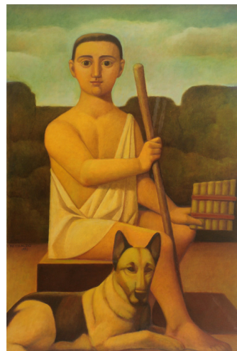
Reynaldo Fonseca Pastoral , 1992, serigrafia