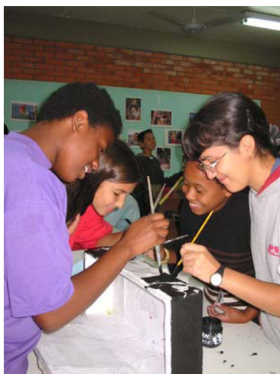
Trabalho em equipe no projeto Que Viagem! O viajante

O projeto Que viagem! – O viajante foi desenvolvido em três escolas municipais da periferia de Porto Alegre: Governador Ildo Meneghetti, Senador Alberto Pasqualini e Saint Hilaire, localizadas nas zonas Norte, Sul e Leste