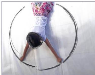
Arte na Escola Contemporânea Novas turmas em breve