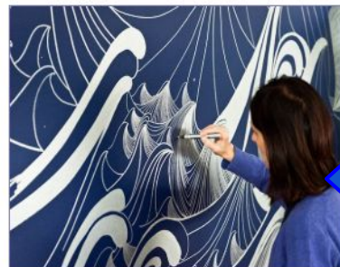
(Per)curso sobre o desenho GRATUITO