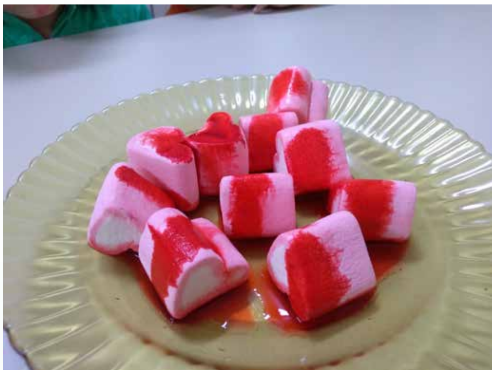
Marshmallow e corante