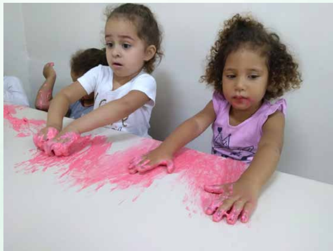
Explorando a slime, textura, cor e sabor

Aquecer os ingredientes no micro-ondas por 1 minuto, na sequência, misturar até ficar homogêneo e pronta para brincar!