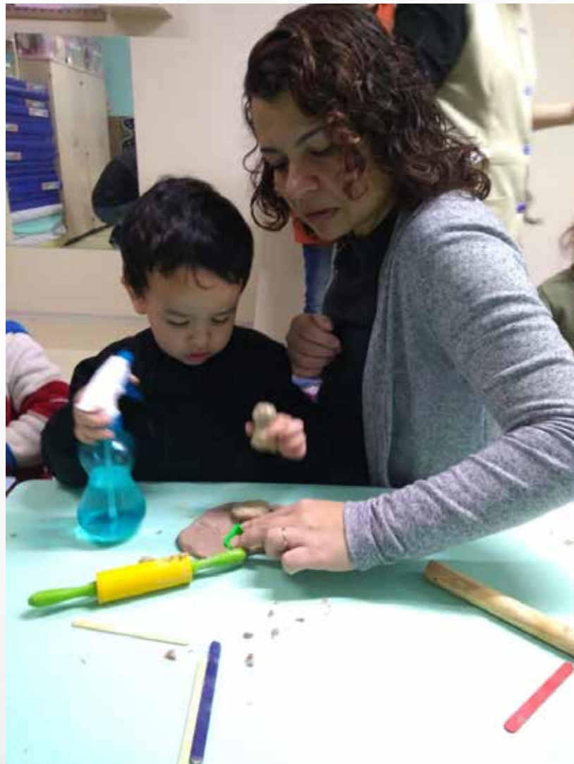
Mãe brincando com seu filho, um ensina o outro.