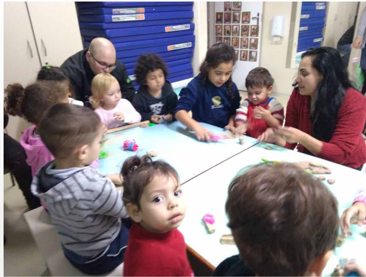
Familiares e crianças modelando argila, com instrumentos como rolinhos, formas de corte, spray de água, palitos de madeira, a criança que seu familiar não veio, brinca com as outras e todos interagem.