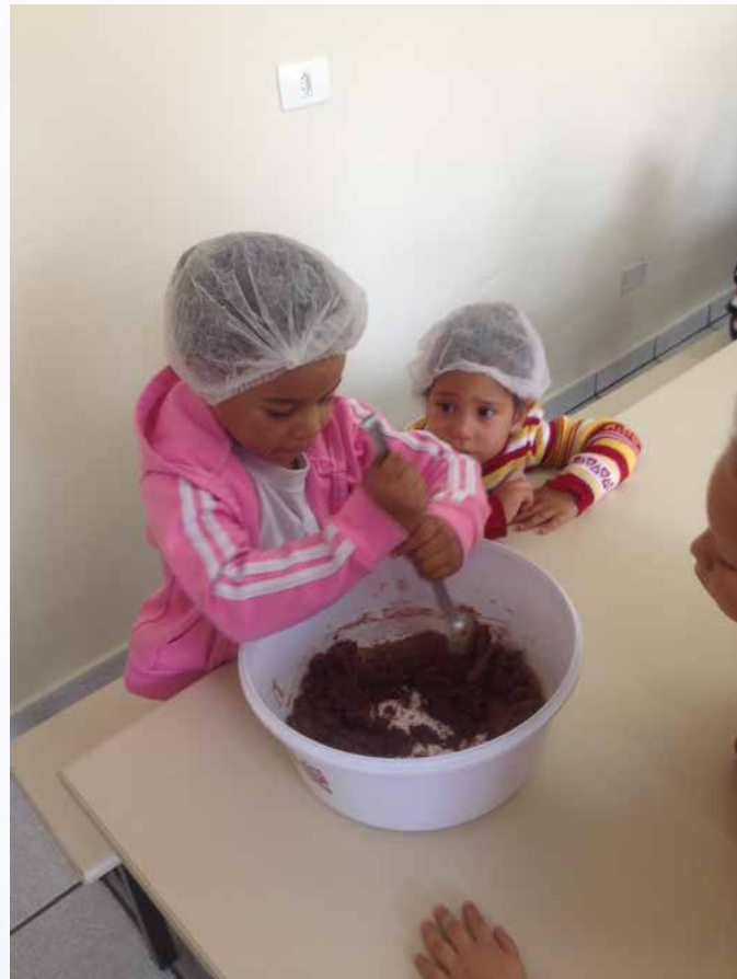
Criança misturando os ingredientes