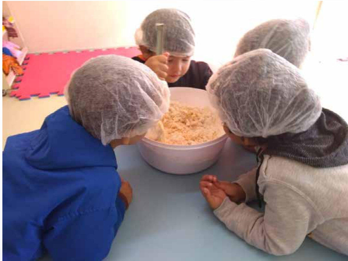
Misturando os ingredientes