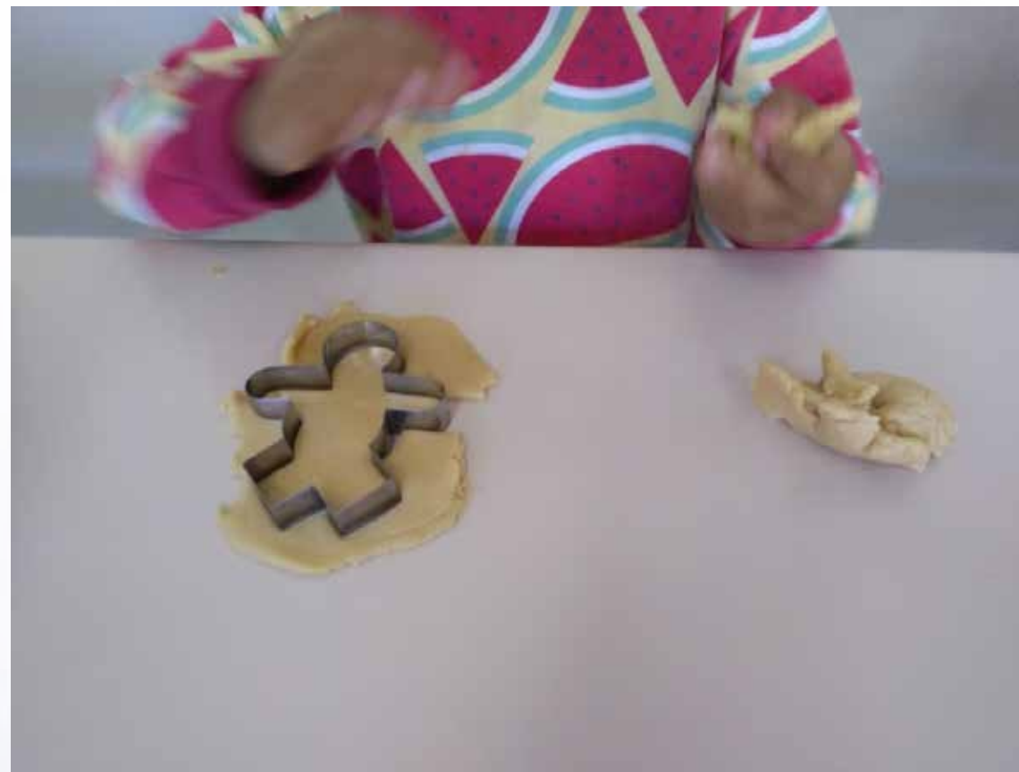
Produzindo os biscoitinhos - cortando com a forma