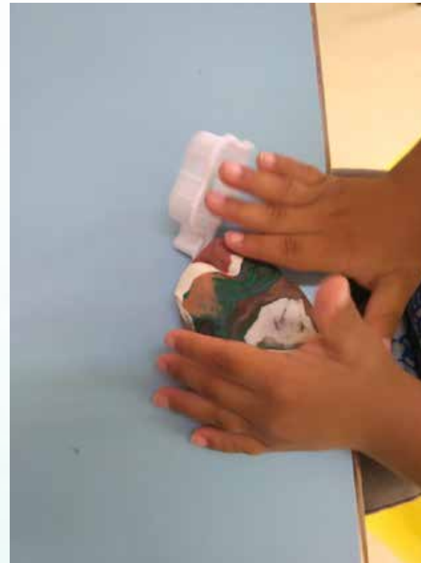
Misturando as cores da massa e cortando com a forma