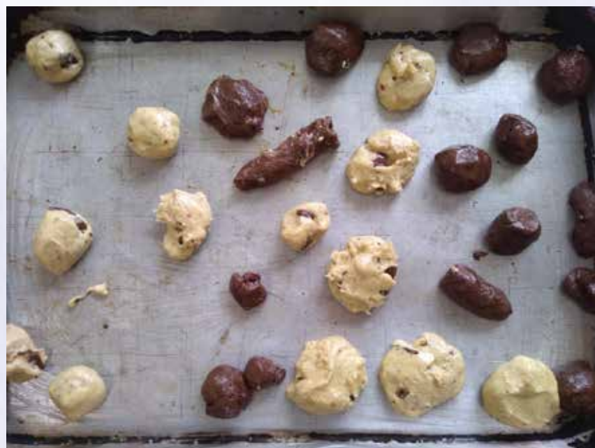
Biscoitos prontos para assar