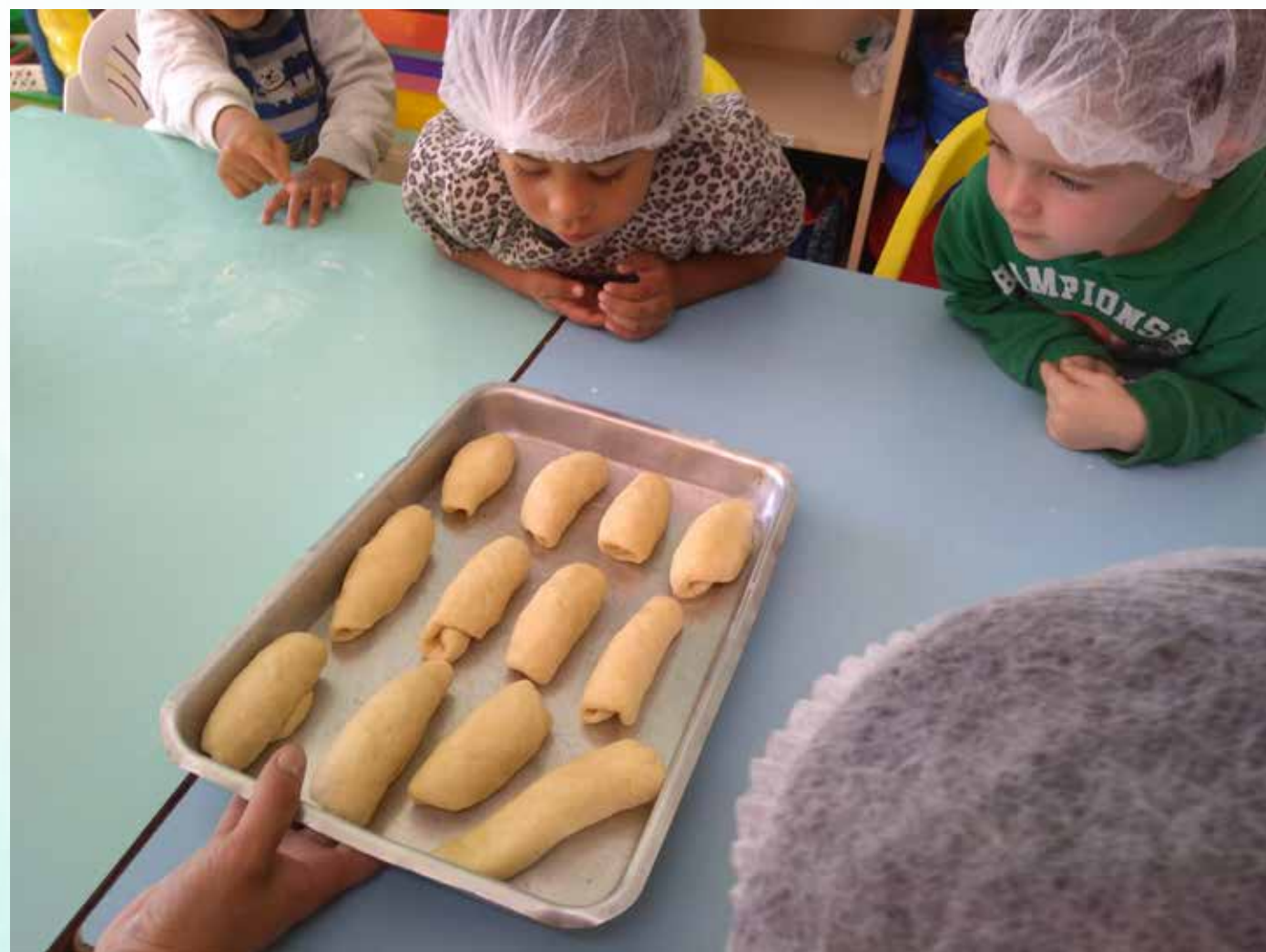
Crianças observando os pães modelados e prontos para assar