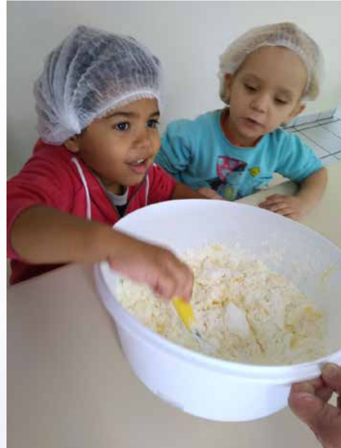
Misturando e observando os ingredientes