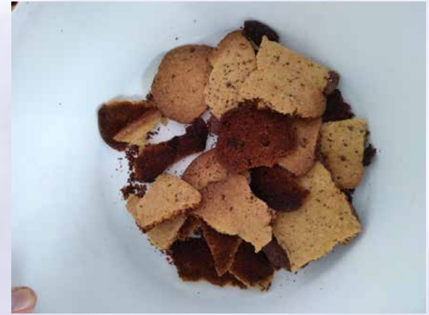
Biscoitos cortados - o processo modifica o resultado final