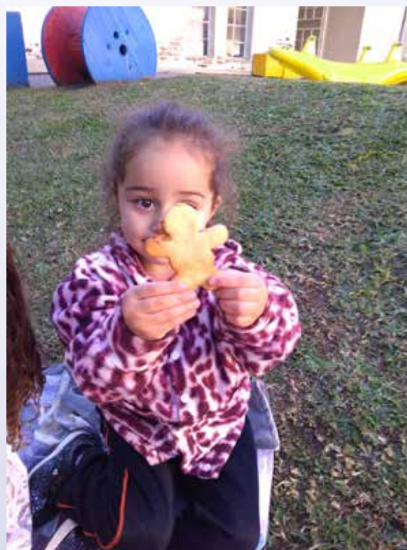
Biscoitinho assado para o piquenique realizado no gramado