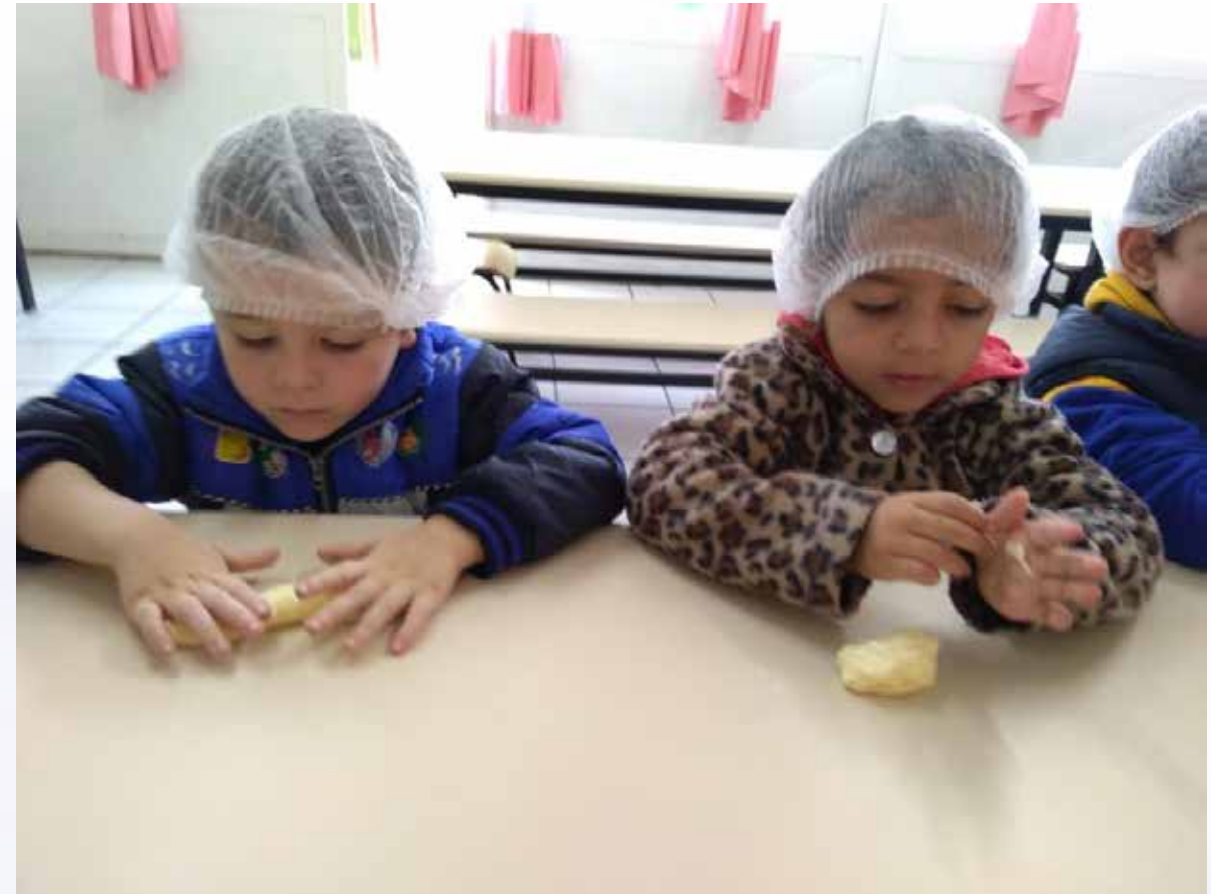
Modelagem do biscoito