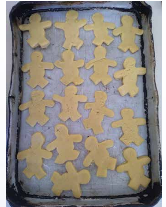
Biscoitos prontos para assar