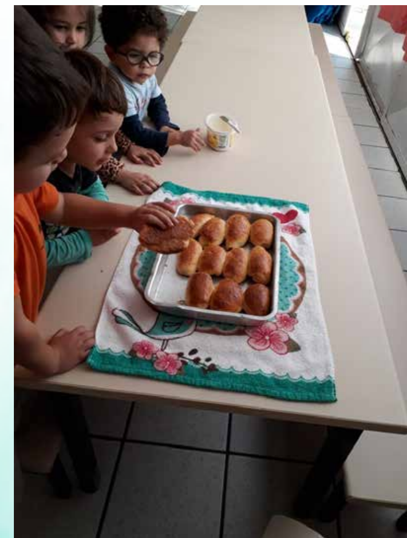
Crianças se servindo do pão para comer.

A receita foi fornecida e enviada pela mãe que veio nos ensinar a fazer o pão.