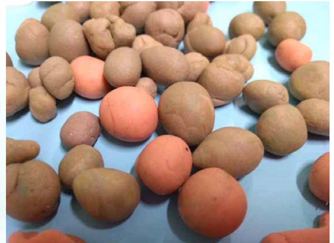
Bolinhas modeladas pelas crianças