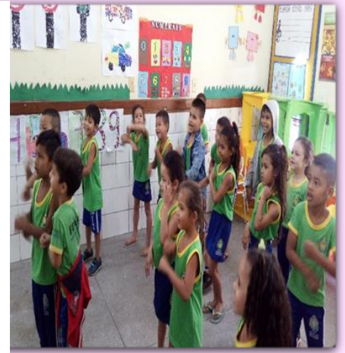
Alunos do 2º Período "B" Movimentos Corporais

BNCC – Campos de Experiências, pg.45. CORDI, Angela. Pé de brincadeira: pré-escola: 4 e 5 anos e 11 meses: Livro do professor da educação infantil/ Angela Cordi; ilustrações: Beto Zoellner ...[et al]- Curitiba: Positivo, 2018. https://www.youtube.com/watch?v=aRy981ouAF5 – Acessado Setembro 2019 https://www.youtube.com/watch?v=6A-L-VKyopg – Acessado Setembro 2019.