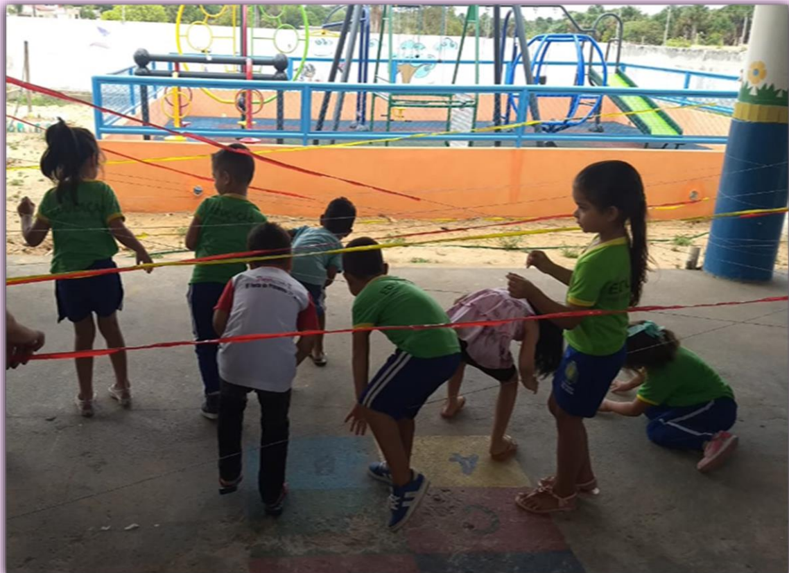
Mostra de Arte 1º Bimestre – Arte Interativa