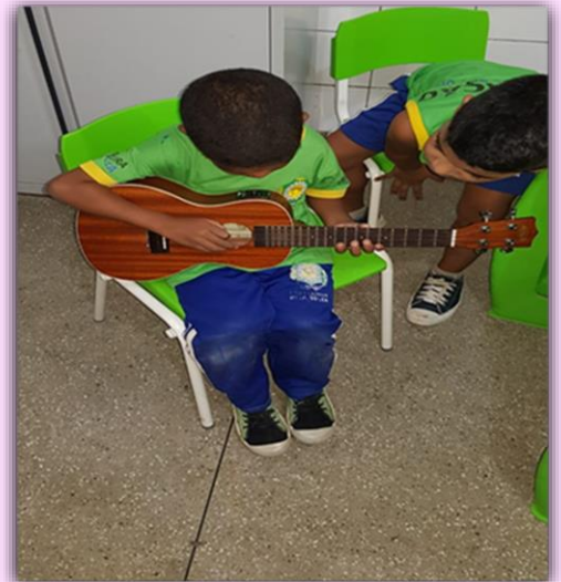
Alunos do 1º Período "A" Descobrimo sons com ukulele

O rato – palavra cantada > https://www.youtube.com/watch?v=e5ADrw5YpHU < Salut Salon "Wettstreit zu viert" | "Competitive Foursome: > https://www.youtube.com/watch?v=BKerUd_xw20c <