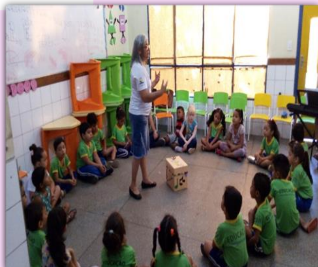
Descobrimo sons e movimentos folclóricos através da caixinha musical