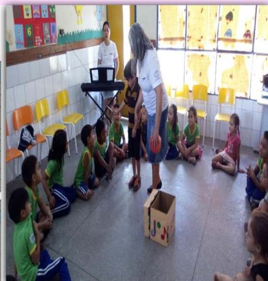
Alunos do 2º Período “B” Exercitando o ritmo através de Brincadeira musical

BNCC – Campos de Experiências, pg.46. JEANDOT, Nicole. Explorando o Universo da Música. São Paulo, Scipione, 1990. pg.71.