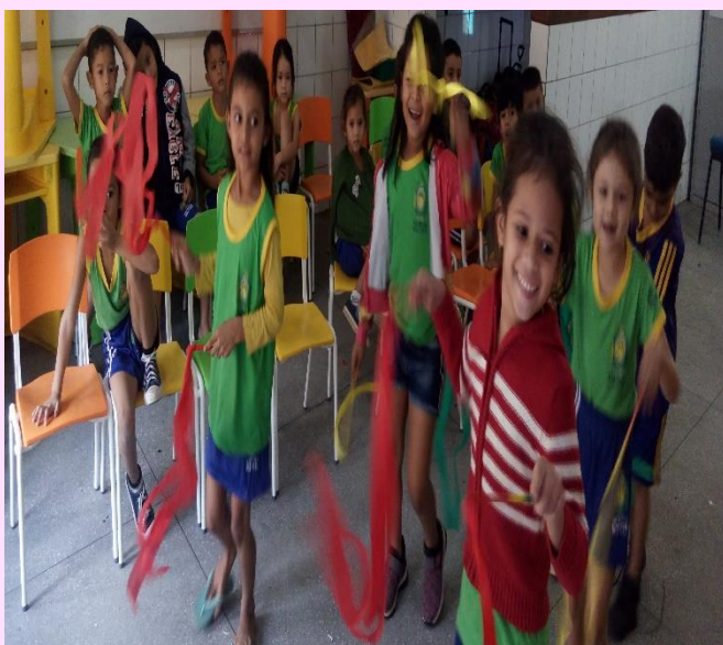
Alunos do 2º Período "B" Coreografia – As cores do semáforo