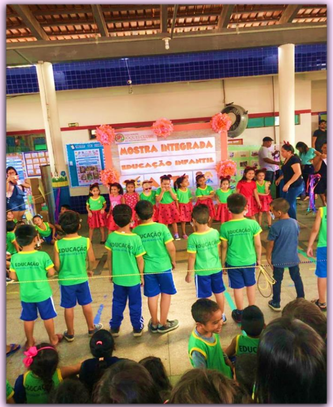
Musical -O hipopótamo e a joaninha