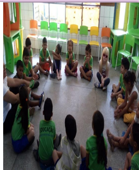
Alunos do 2º Período “A” Roda de conversa: Explicando a atividade