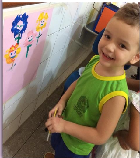
Turminha do 1º Período "A" Cantinho da Pintura