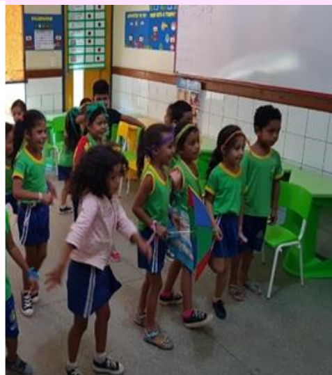
Turminha do 1º Período "B" Criando coreografias

REFERÊNCIAS https://novaescola.org.br/conteudo/116/cantigas-roda-pre-escola https://novaescola.org.br/plano-de-aula/3864/organizando-coreografias Quem Te Ensinou a Nadar / Peixe Vivo - Tiquequê ft. Barbatusques - Coreografia | FitDance Kids https://www.youtube.com/watch?v=jVk0ZgLn378