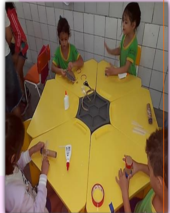
Alunos do 2º Período “B” Confeções de instrumentos musicais com materiais recicláveis