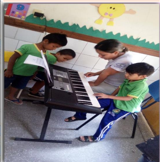
Alunos do 2º Período “B” experiência musical com teclado