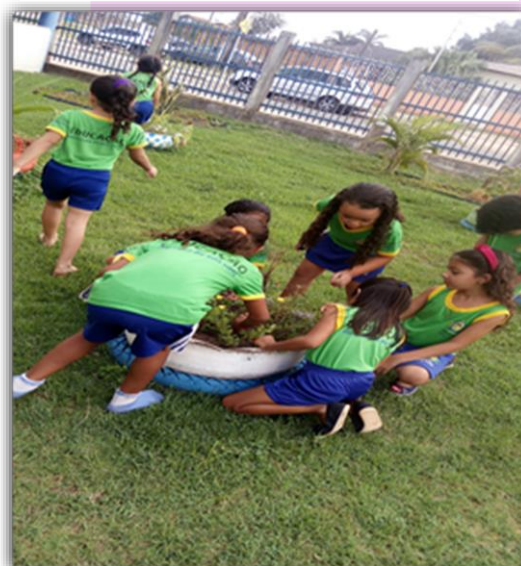
Alunos do 2º Período “C” Explorando a Natureza no espaço da escola