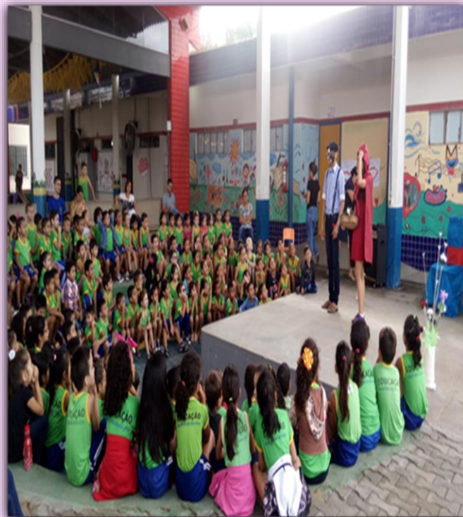
História Cantada - Chapeuzinho vermelho