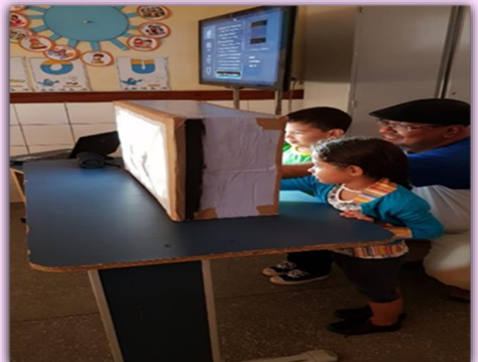
Turminha dos 1º Período "B" Experiência com Teatro de Sombras: O rato