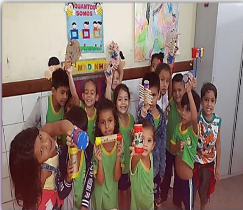
Alunos do 2º Período “B” Socialização da atividade