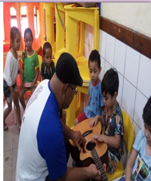
Alunos do 1º Período "A" Conhecendo instrumento musical ( violão) e explorando som

> http://basenacionalcomum.mec.gov.br/abase/#infantil/os-objetivos-de-aprendizagem-e-desenvolvimento-para-a-educacao-infantil <