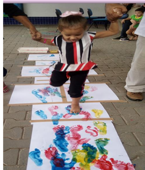
Alunos do 1º Período "A" Explorando cores e texturas através da brincadeira amarelinha