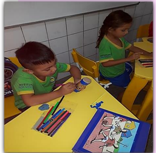
Alunos do 2º Período “B” Releituras das obras do artista Ivan Cruz

BNCC – Campos de Experiências, pg.46 JEANDOT, Nicole. Explorando o Universo da Música. São Paulo, Scipione, 1990. pg.83,84. http://aprendendo-e-brincando.blogspot.com/2013/04/biografia-do-artista-plastico-ivan-cruz.html - Acesso Maio/2019