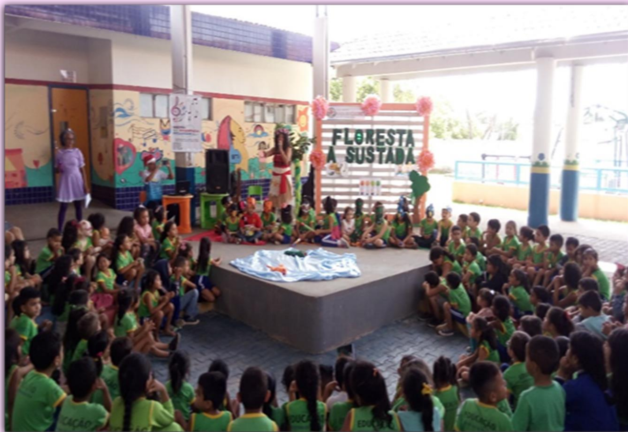
História sonorizada – A floresta assustada