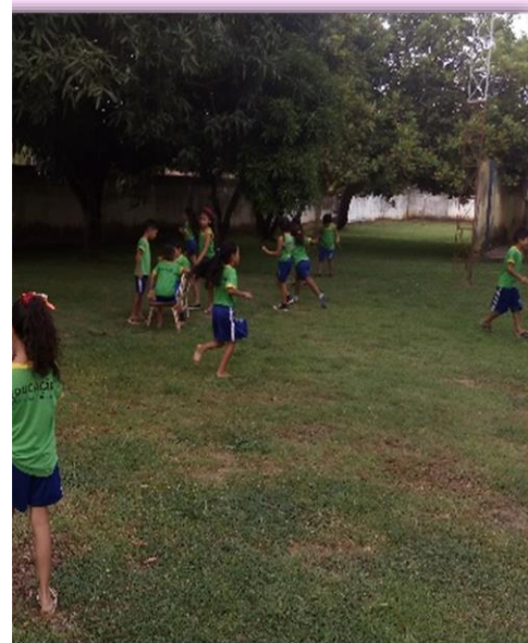
Alunos do 2º Período “A” Passeio no jardim Coreografia- Imitando os bichos