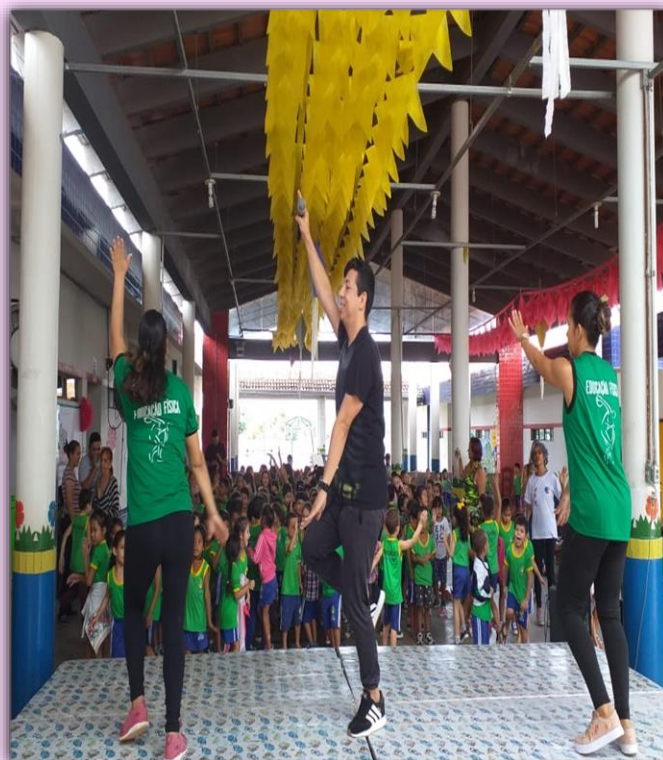
Corpo em Movimento - Zumba Kids