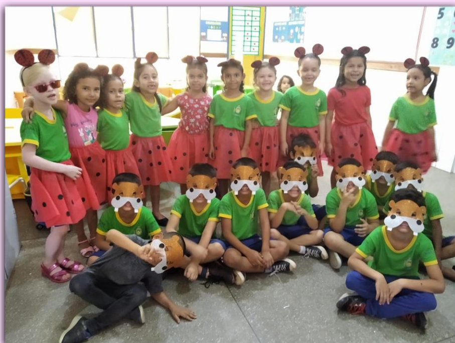
Alunos 2º Período - Hipopótamos e joaninhas