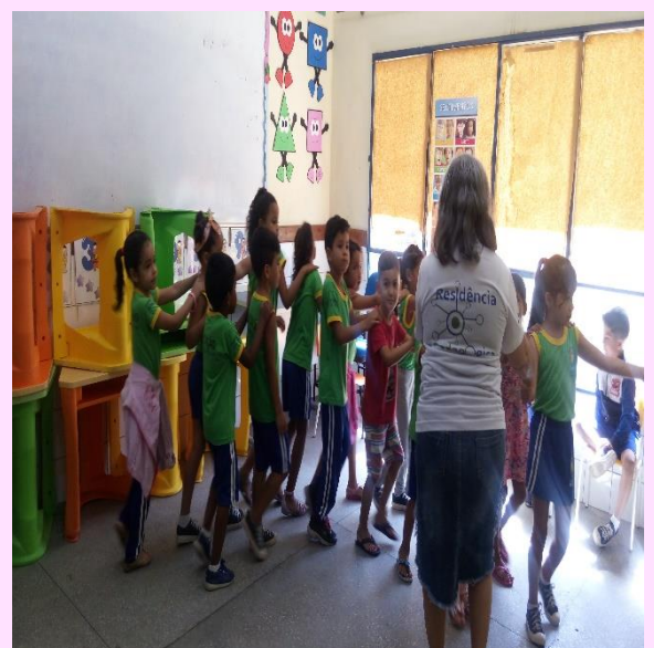
Alunos do 2º Período "B" Coreografia- Trem de ferro