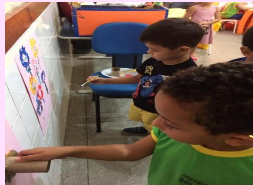
Alunos do 1º período "A" - Cartaz das flores