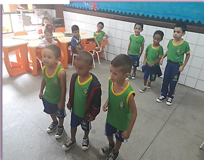
Turminha do 1º Período "A" Criando coreografias