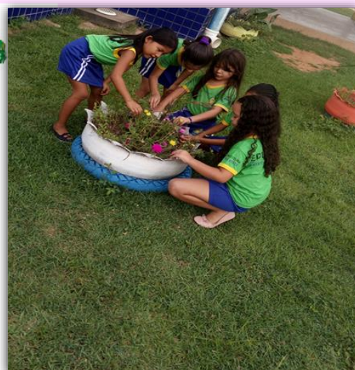
Alunos do 2º Período “C” Explorando a Natureza no espaço da escola