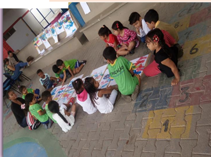
Alunos do 1º Período "A" conhecendo as cores secundárias