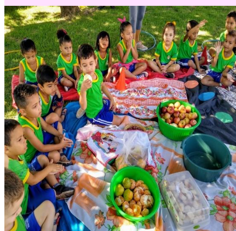
Alunos do 1º Período "A" Piquenique saudável