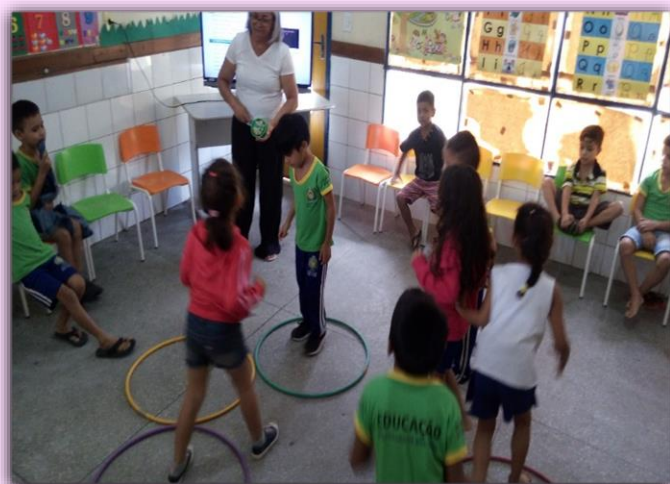
Alunos do 2º Período “A” Movimentos rítmicos com bambolê