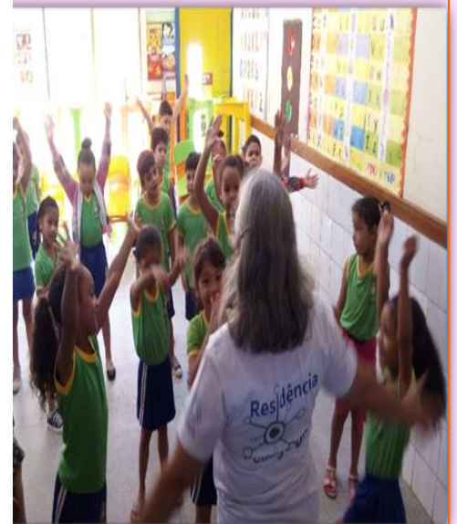
Alunos do 2º Período "B" Aquecimento