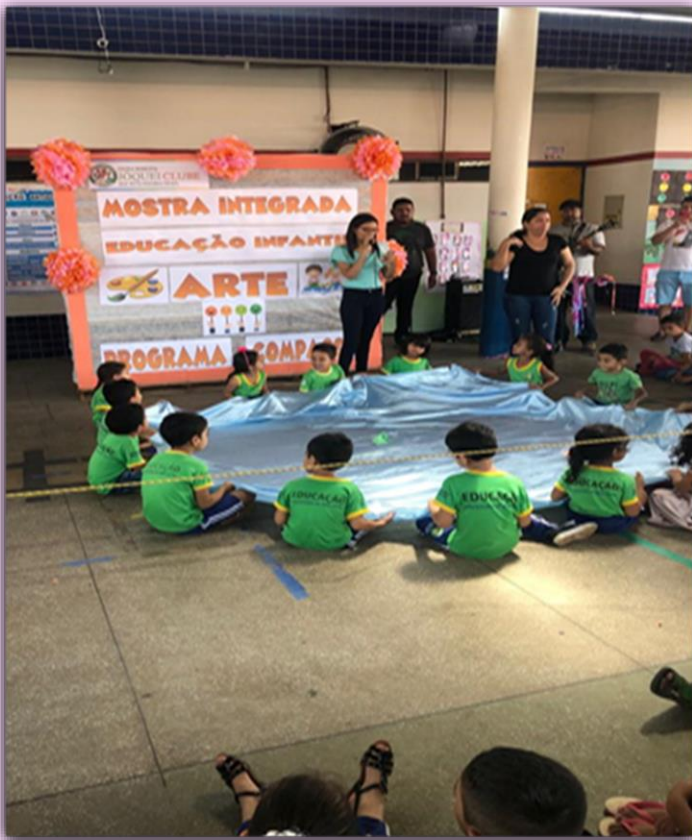
Alunos 1º Período – Apresentação musical – Jangada/ Dorival Caymmi