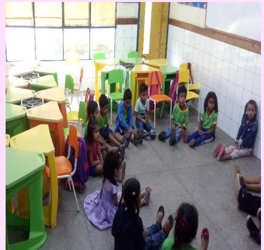
Alunos do 1º período "B" - Roda de conversa sobre as cores.