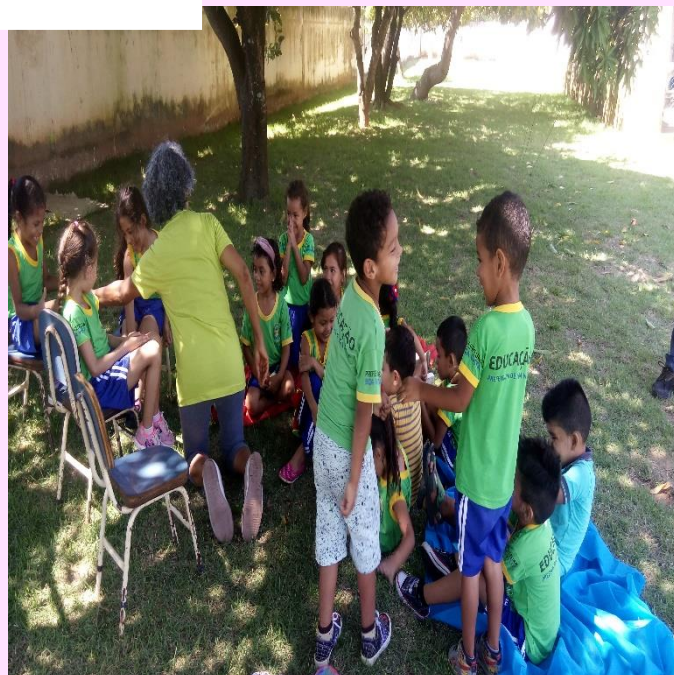
Alunos do 1º Período "A" Piquenique saudável