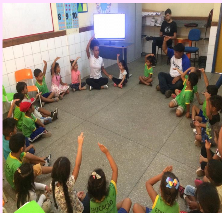
Sons – longo e curto