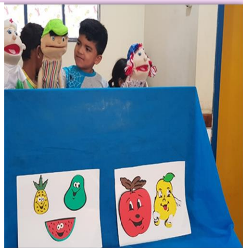
Alunos do 1º Período "B" Teatro de fantoche: O menino que não comia frutas