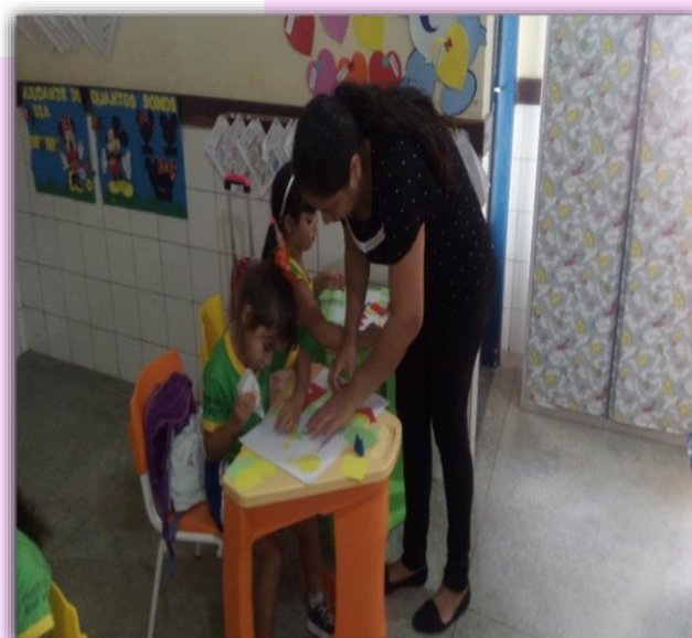
Alunos do 2º Período “C” Confeccionando arranjos florais