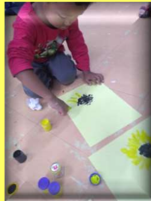
Observação e pintura com tinta guache