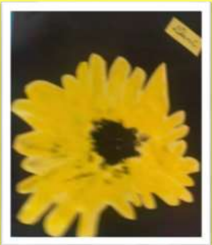
EXPOSIÇÃO SUSPENSA – Obras de arte confeccionadas pelas crianças inspiradas nos Girassóis de Van Gogh