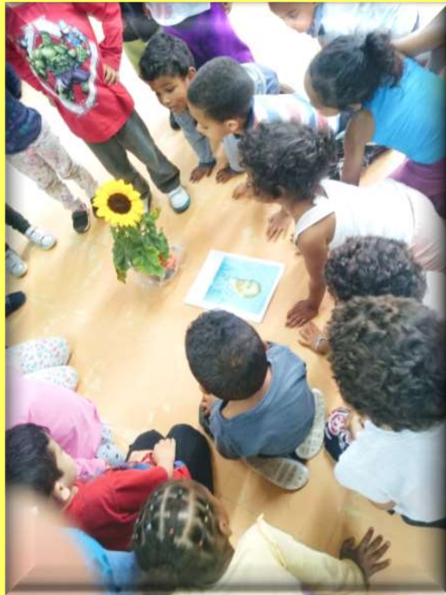
Primeiro contato das crianças com a flor de girassol e apresentação do artista Vicent Van Gogh