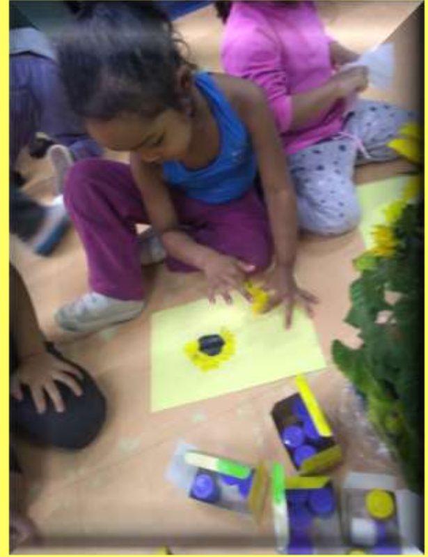
Observação e pintura com tinta guache