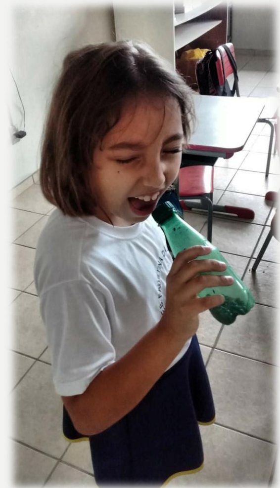
Acima, aluna do 1º ano.

Todo o envolvimento artístico foi muito importante para o desenvolvimento psicoemocional das crianças, refletindo em suas auto estimas, no encontro de seus pares e de seus lugares no grupo.