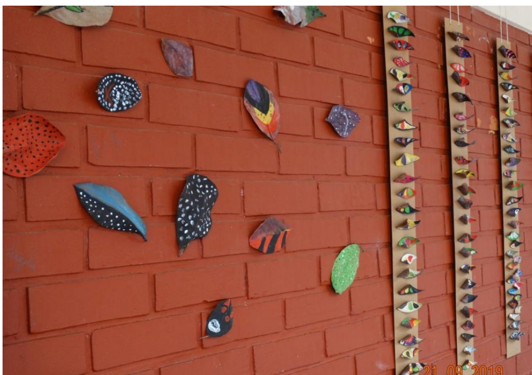
Exposição de folhas de jaca e sementes pintadas.