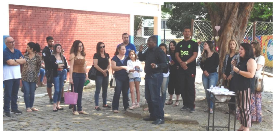
Encerramento do Projeto Refazenda Agradecimentos e entrega de lembranças aos participantes

Publicação em mídia regional https://www.tribunadoleste.com.br/2019/10/refazenda-alunos-produzem-esculturas-a-partir-da-semente-de-abacate/