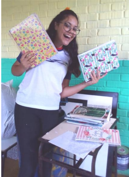
Arrecadação de cadernos usados, no final do ano letivo para reaproveitamento