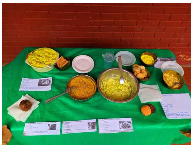
Alimentos produzidos acompanhados de suas respectivas receitas