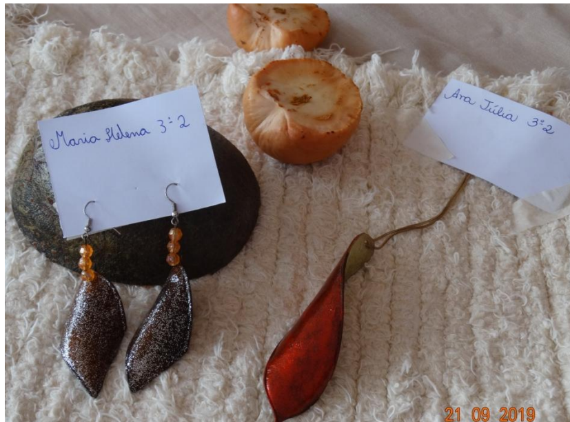
BioBijuterias com sementes de Sibipiruna