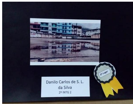
Foto Premiada 2º lugar Quadra escolar - reflexo do Entorno da escola