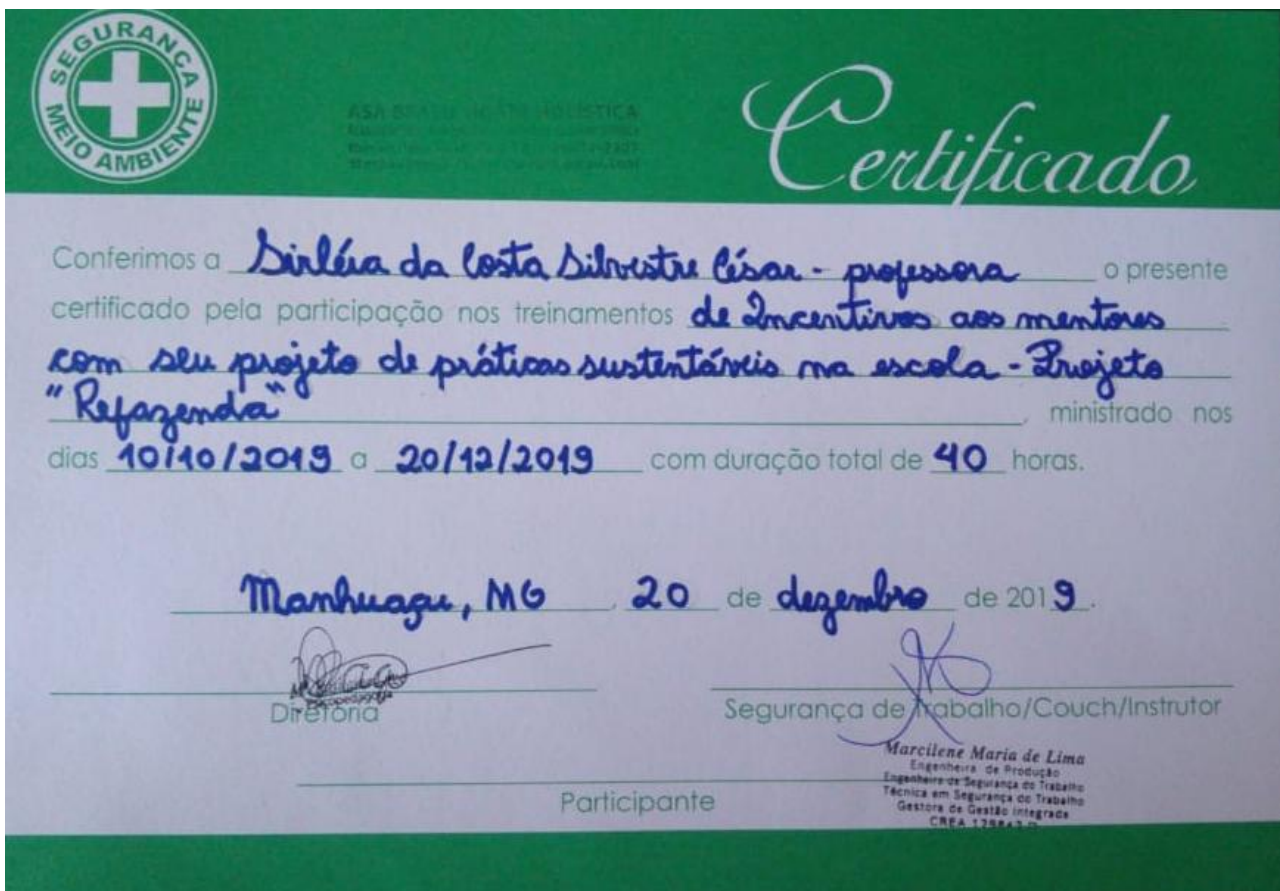
Certificado de Reconhecimento do Projeto Refazenda