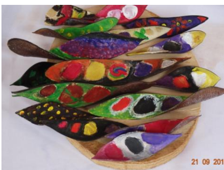
Objeto de decoração com sementes pintadas por diversos alunos