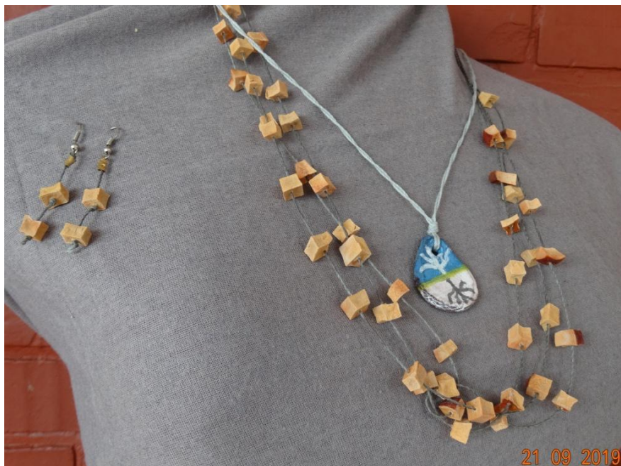
BioBijuterias com sementes de Abacate desidratadas