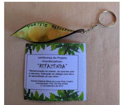
Chaveiro de semente de Sibipiruna, colhida nas dependências da escola – feito pelos alunos

Publicação em mídia regional https://www.tribunadoleste.com.br/2019/10/refazenda-alunos-produzem-esculturas-a-partir-da-semente-de-abacate/