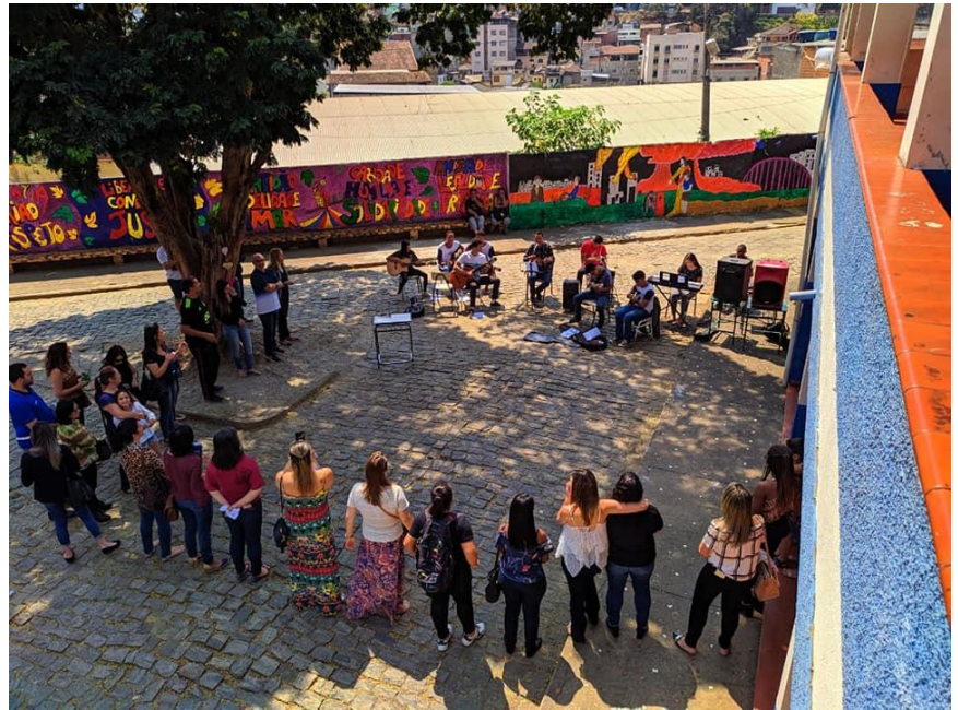
Apresentação da Música Refazenda á sombra do Pau Brasil