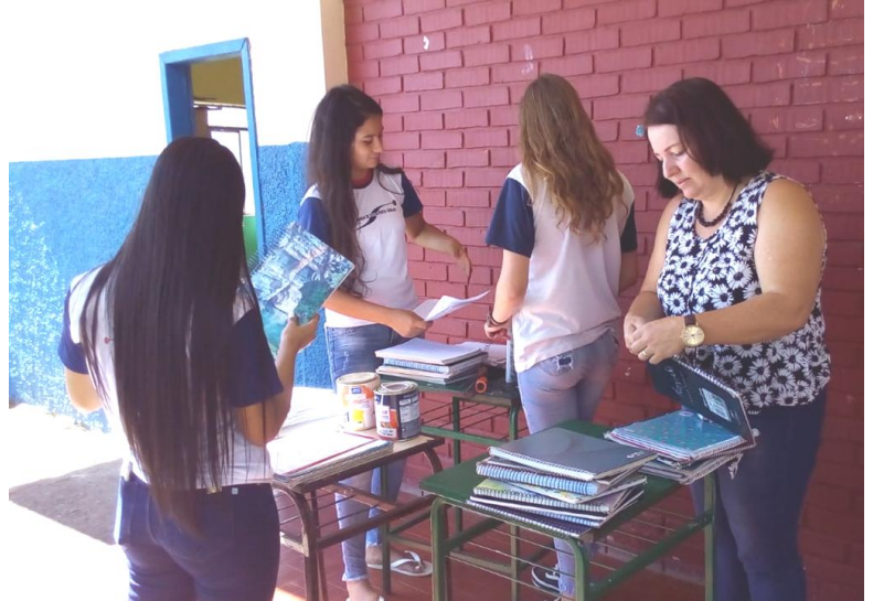
Preparação dos cadernos a serem doados para alunos carentes