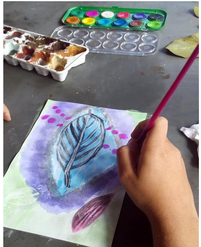
Pintura em aquarela - Estudo para ilustração científica das espécies de plantas no entorno da escola