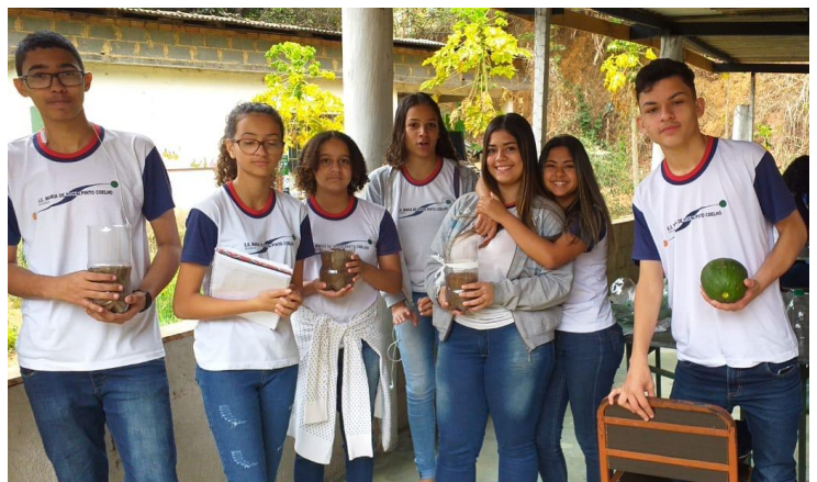
Momento de orientações para plantio