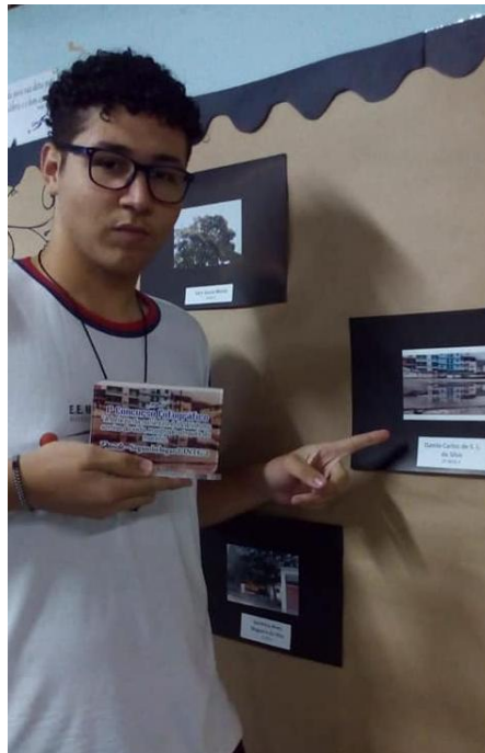
2º lugar Concurso de Fotografia Danillo Carlos