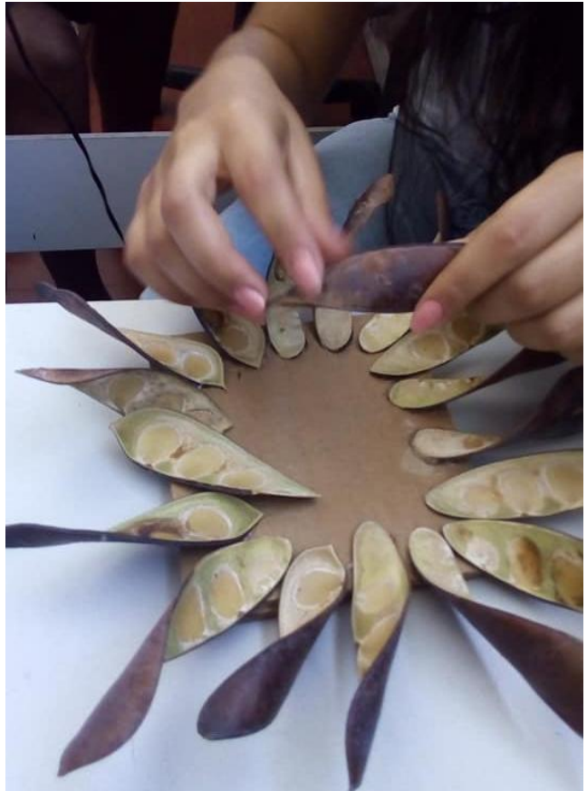
Aula de Arte - Construção de escultura com sementes de Sibipiruna