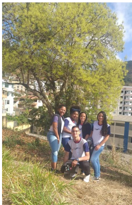
Alunos realizando o levantamento de dados