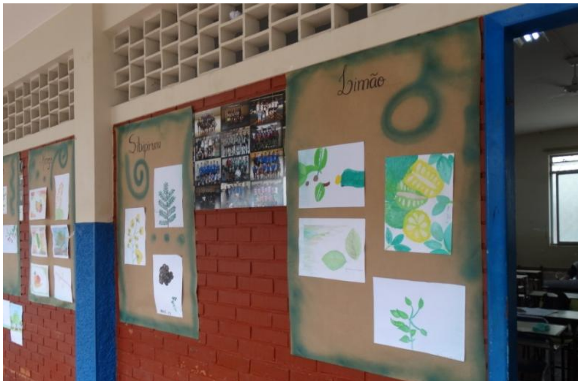
Painéis com ilustrações botânicas