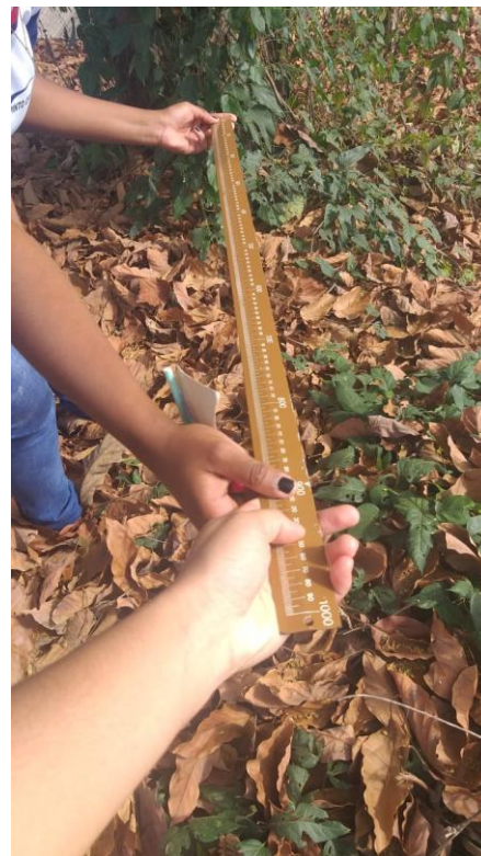
Alunos realizando o levantamento de dados