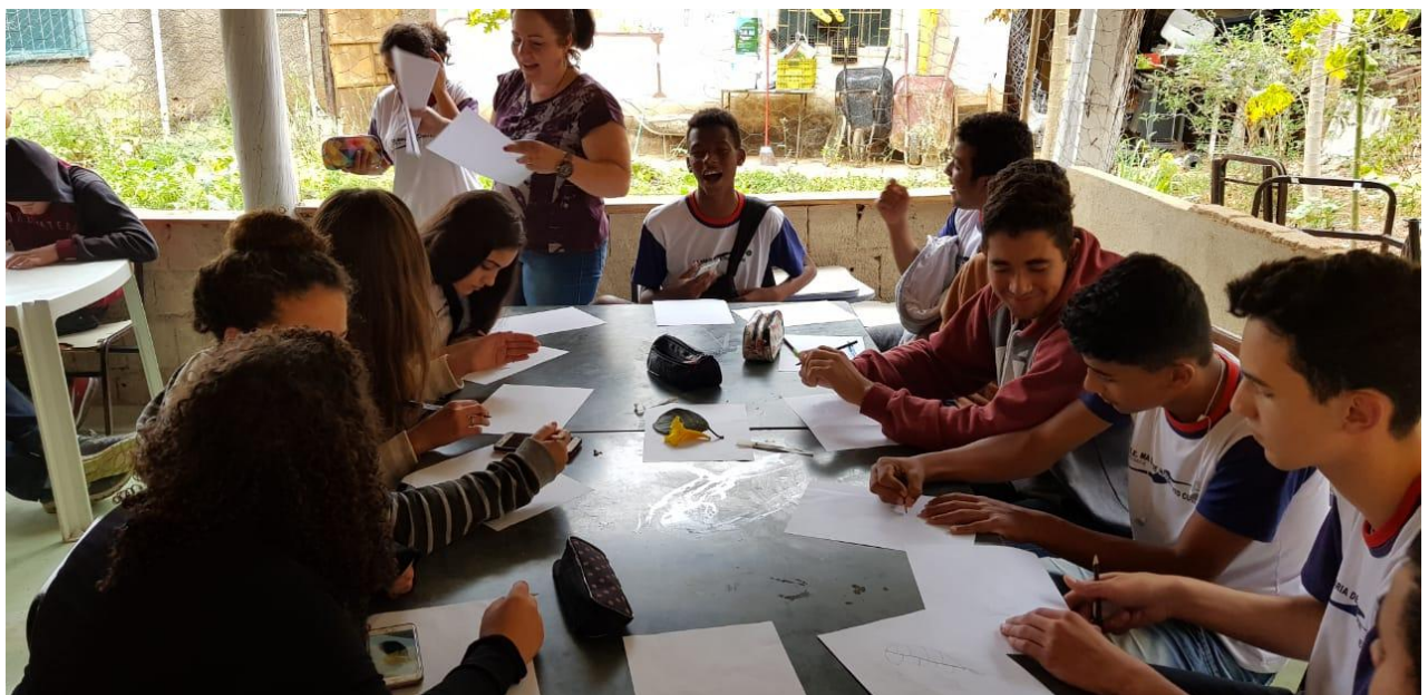
Aula de Arte - Desenho de observação - Elementos da natureza no espaço escolar