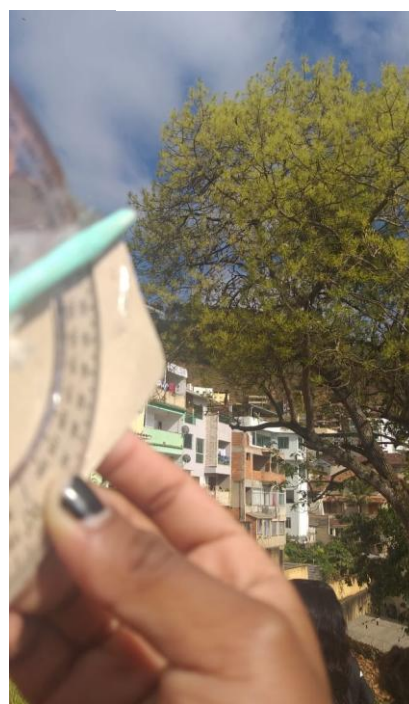
Hipsômetro rudimentar elaborado pelos alunos para medir a altura do Abacateiro