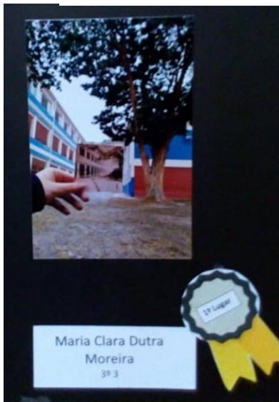
1º lugar Concurso Fotografia Foto de uma foto