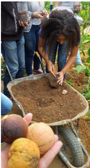
Preparação para plantio de sementes