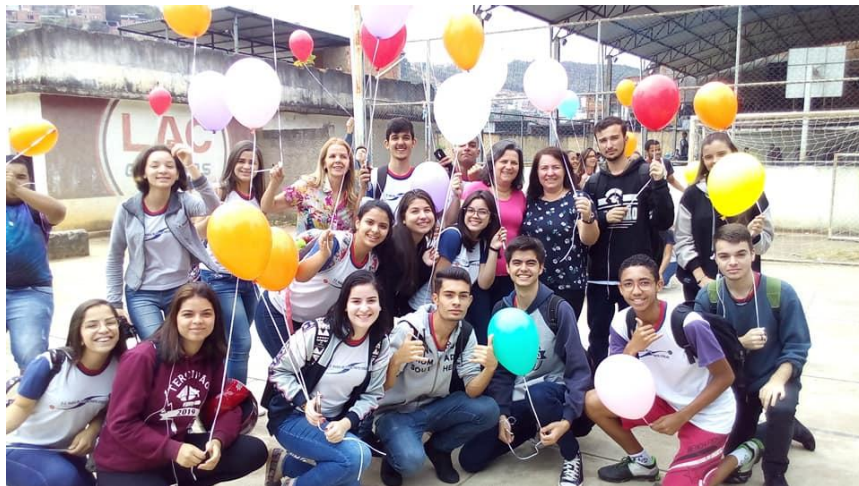
Momento de dispersão das sementes com uso de balões biodegradáveis.