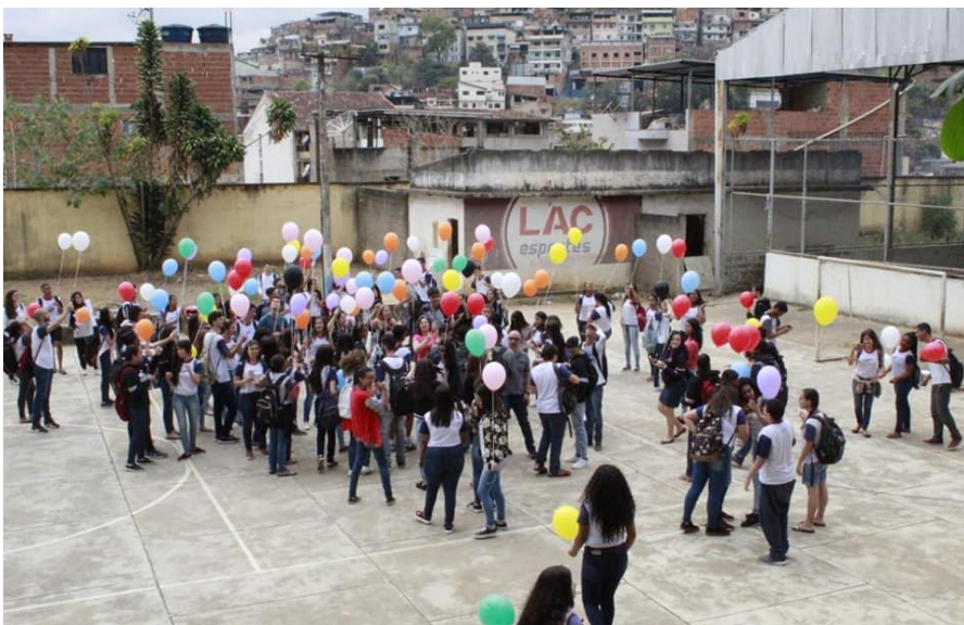
Momento de dispersão das sementes com uso de balões biodegradáveis.