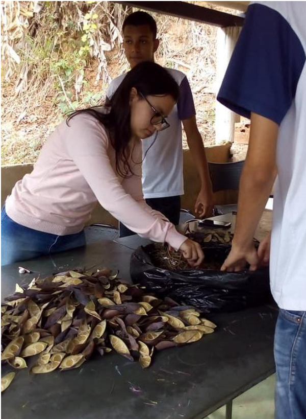
Aula de Arte - Seleção de sementes