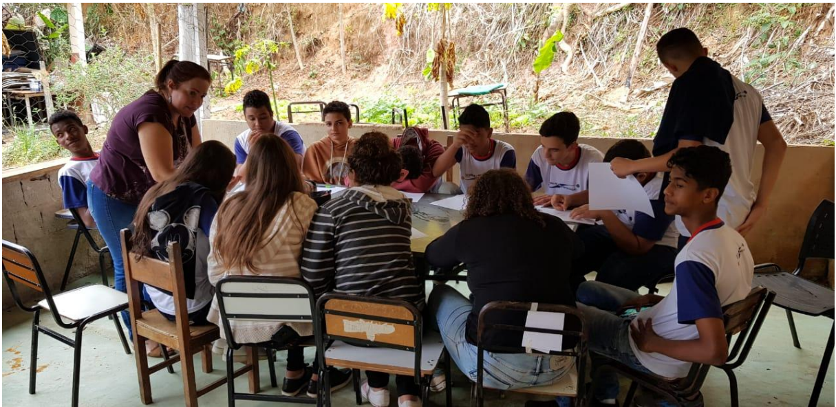
Aula de Arte no Espaço Integrart - Diálogo sobre o Projeto Refazenda