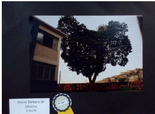
Foto premiada 3º lugar Pau Brasil - Formato Coração