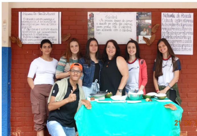
Degustação de alimentos preparados pelos alunos do Tempo Integral