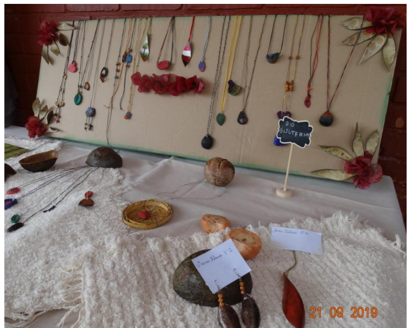
Exposição de BioBijuterias