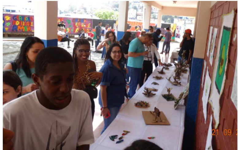
Visitação da exposição - Projeto Refazenda