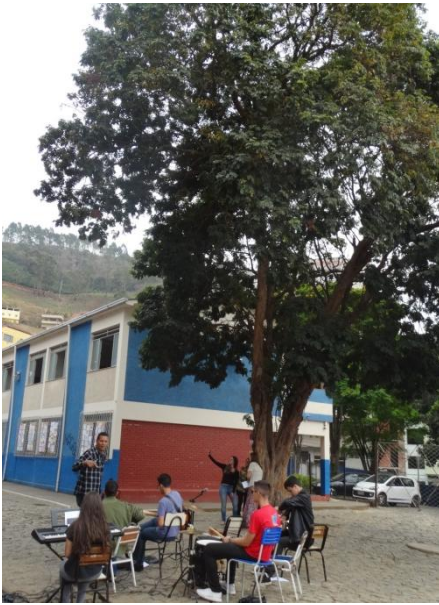
Ensaio da Música Refazenda