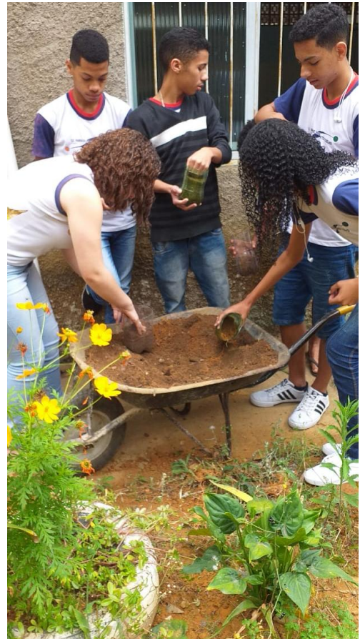
Preparação para plantio de sementes