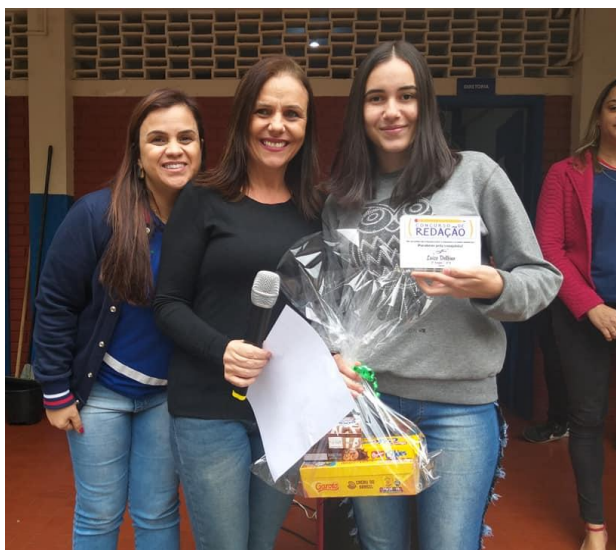
Premiação Concurso de Redação