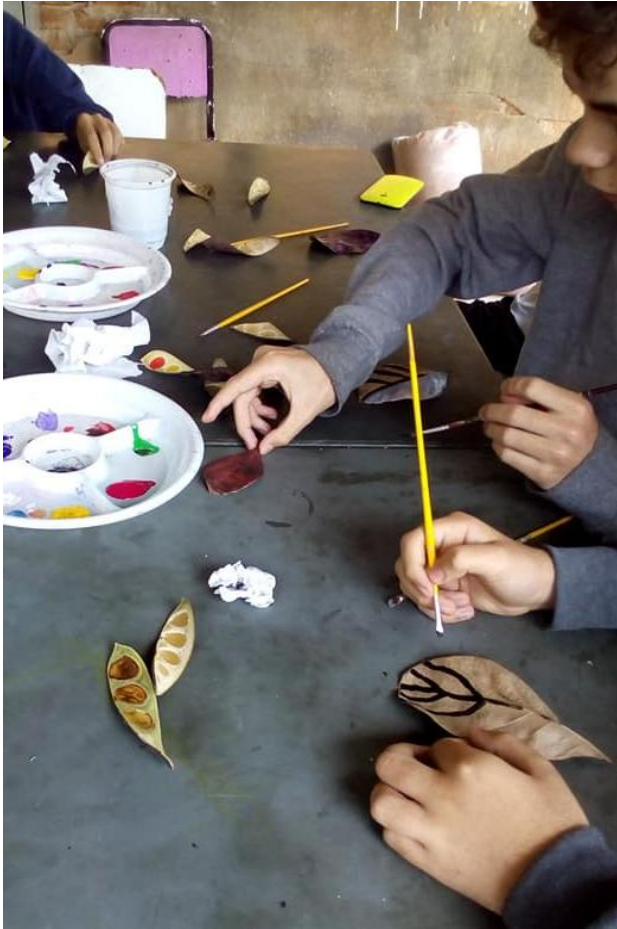
Alunos pintando as sementes e folhas