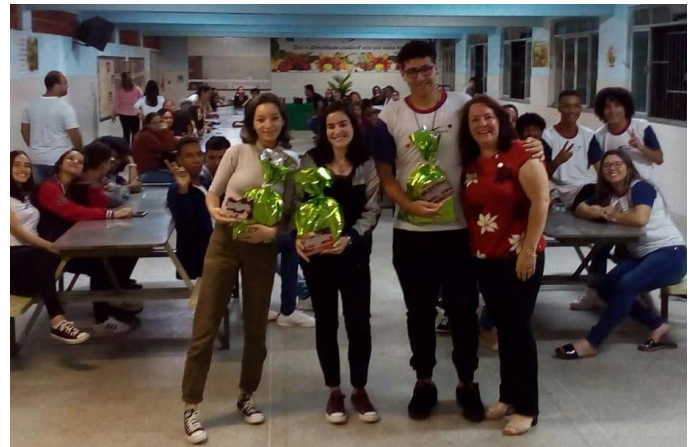
Premiação Concurso de Fotografia