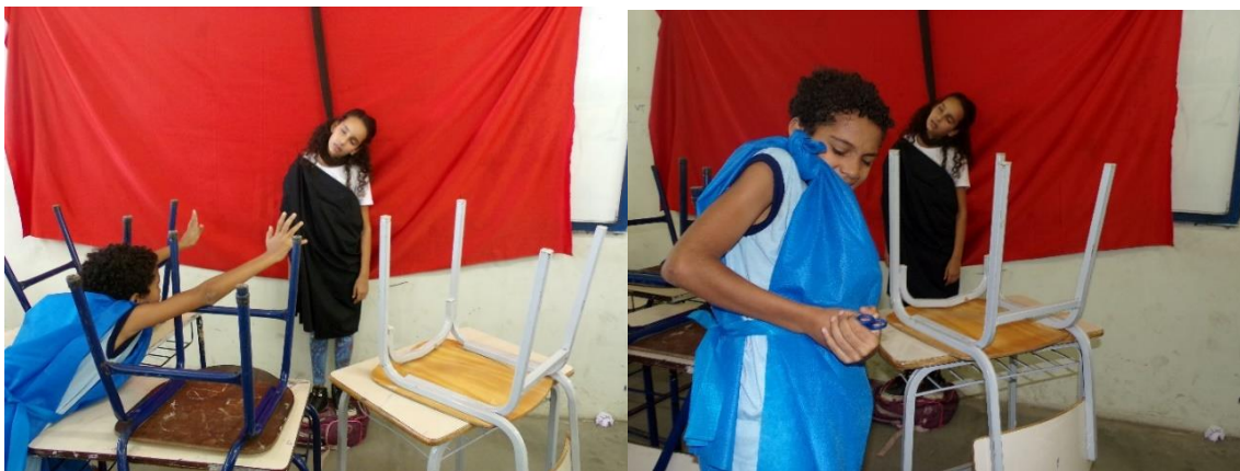
Figura 15 e 16 - Hemon, o filho de Creonte, tendo encontrado a noiva morta, apunhalou-se.