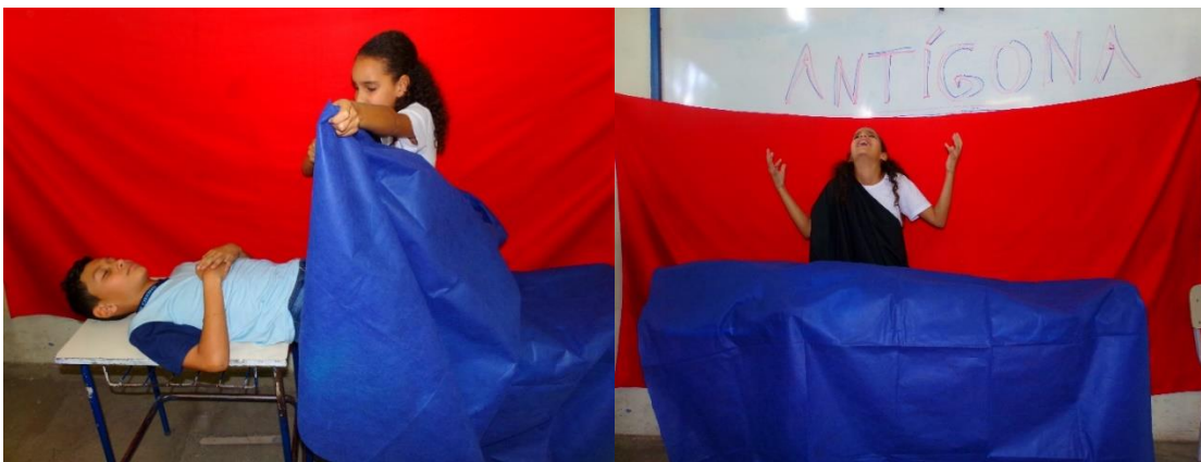
Figura 3 e 4 - Antígona desafia o rei e enterra seu irmão.. Diz Antígona com firmeza: "Não fui feita para o ódio e sim para o amor".