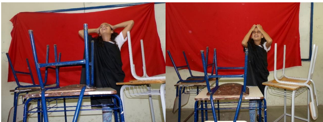
Figura 11 e 12 – Antígona se desespera. Creonte, apesar de se revoltar contra o profeta cego, resolve soltar Antígona, mas já é tarde demais.