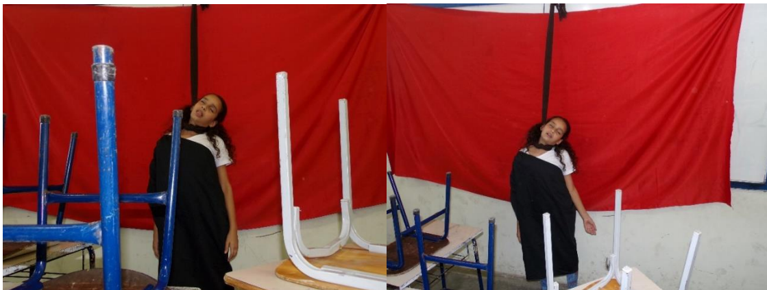
Figura 13 e 14 - Um mensageiro relata que Antígona preferiu enforcar-se a aguardar a morte lenta.