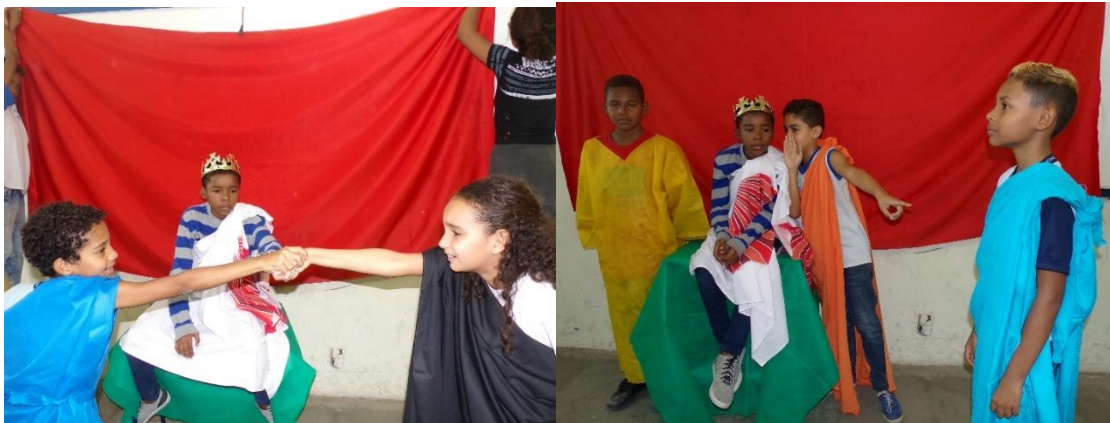
Figura 7 - Por ordem de Creonte, Antígona é condenada a ser emparedada numa caverna, até morrer.