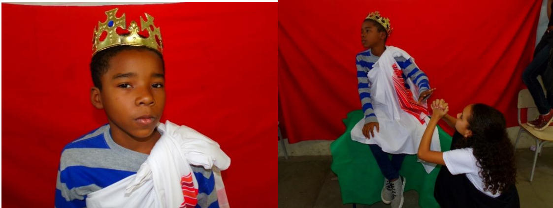
Figura 1 - O rei Creonte ordena que o corpo de Polínez fosse largado a esmo, sem sepultamento pois este cometera um ato ilegal. Figura 2 - Antígona implora para que o rei permita que ela enterre seu irmão.

10. Montagem e registro fotográfico das cenas apresentadas em sala com falas e marcas decoradas, figurinos e cenários simbólicos. E posterior apresentação da montagem à um público convidado.