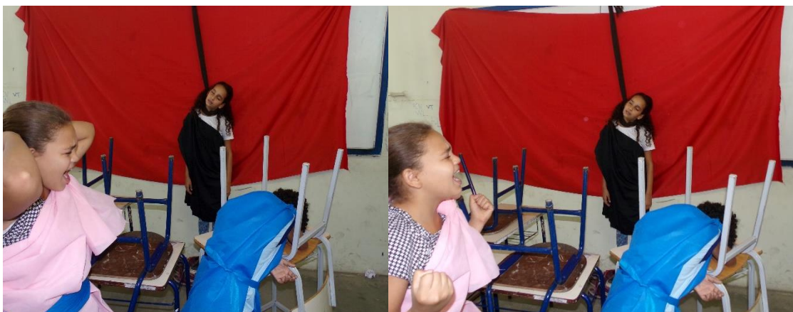
Figura 12 e 18 - E quando Eurídice, a esposa de Creonte, é informada de que perdeu seu único filho, mata-se também.