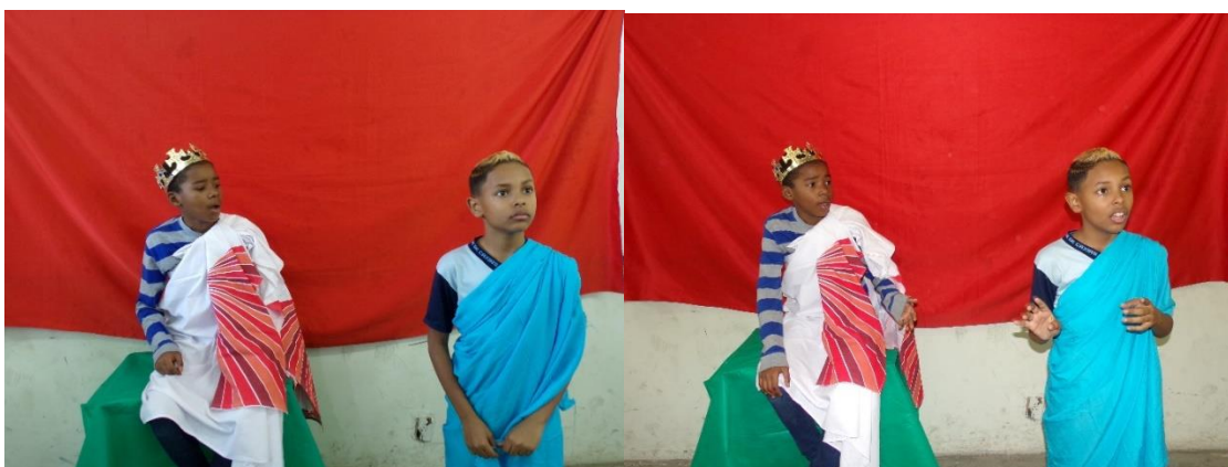
Figura 9 – Tirésias reprova Creonte por profanar o corpo do irmão de Antígona, advertindo-o de que será punido pelos deuses.