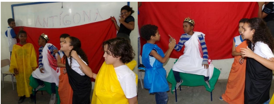
Figura 5 - Mas Creonte não perdoa, mesmo sabendo que Antígona se casará com seu filho Hemon, Creonte não cede.