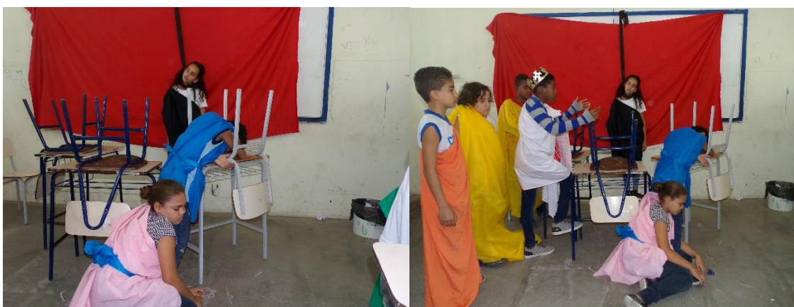
Figura 19 - Creonte, ao ver toda a família morta, lamenta-se pelos seus atos