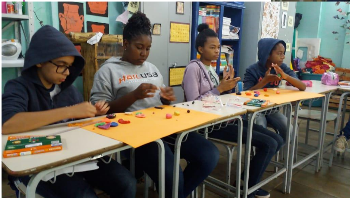
Sala de Arte: ateliê-galeria Obs: registro da turma do 6º ano (2019) ou 5º ano em 2018 em oficina de escultura – técnica: modelagem