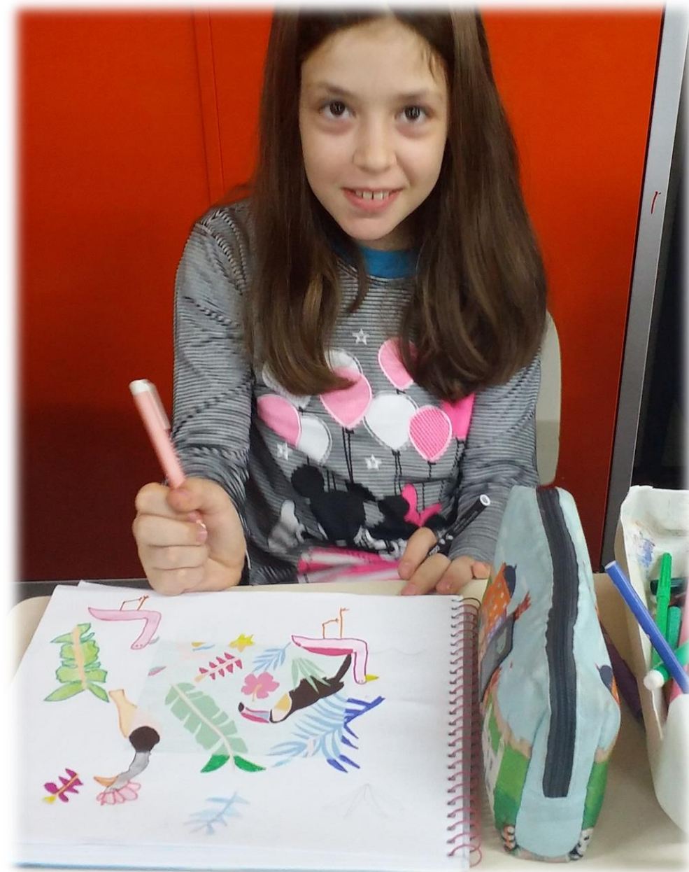
DESENHO DE OBSERVAÇÃO E CRIAÇÃO A PARTIR DE DESENHO 4º/5º ANO (2018)