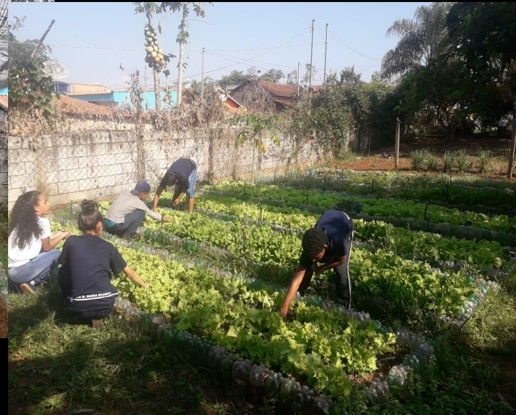
Horta – estudo sobre a importância e o valor da água