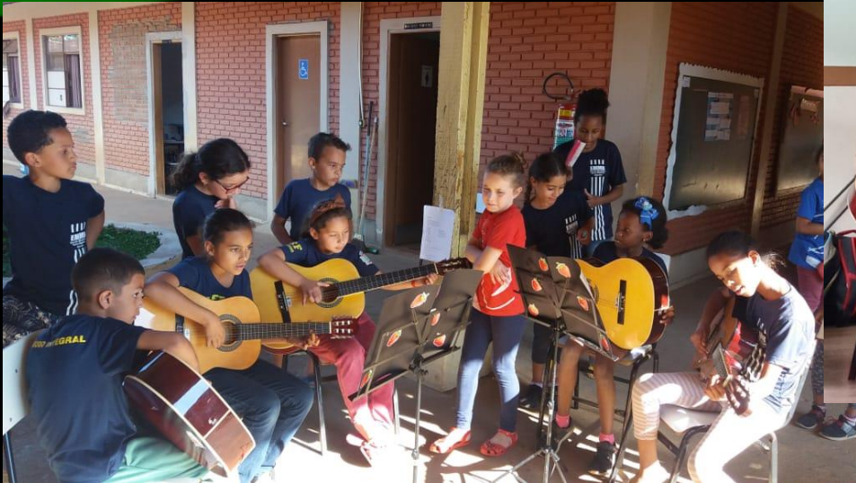
Música nos corredores da escola...