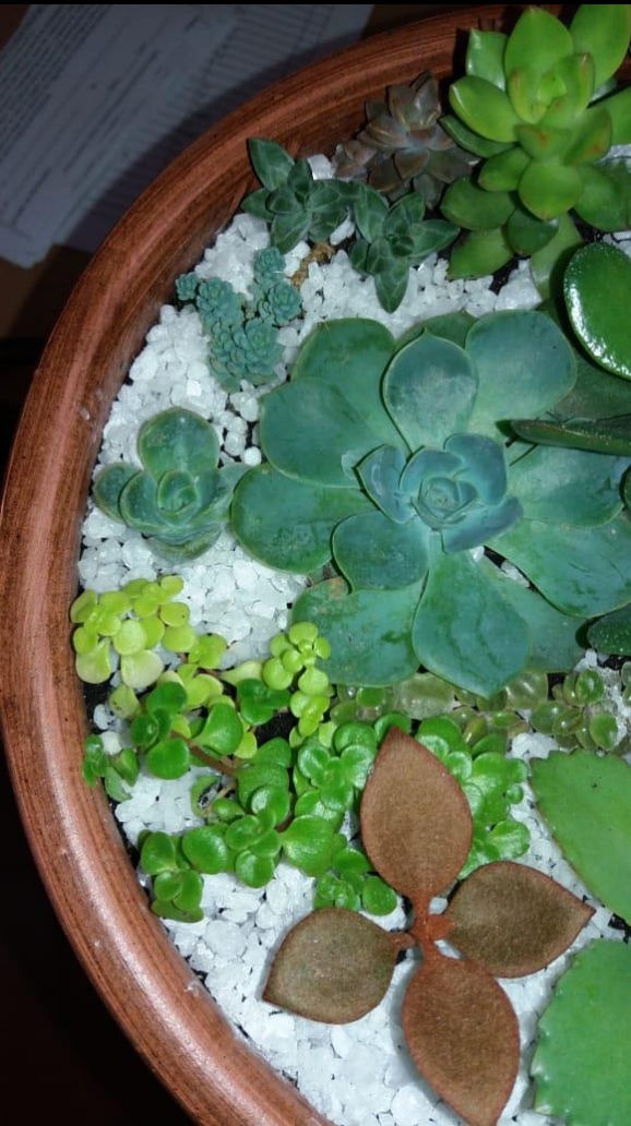
Vaso de Suculenta