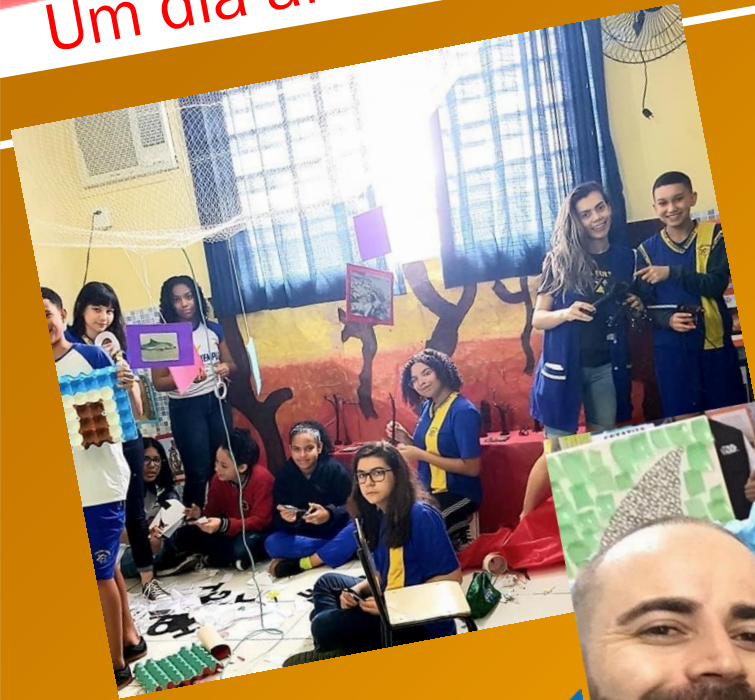
Alunos e professores trabalhando na montagem da sala.