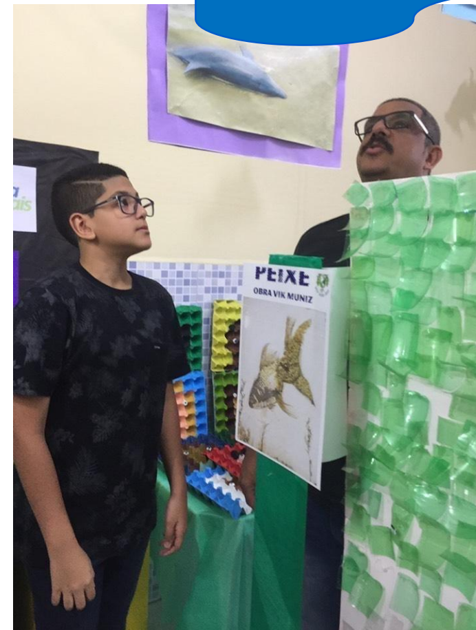
Alunos compartilhando os conhecimentos adquiridos