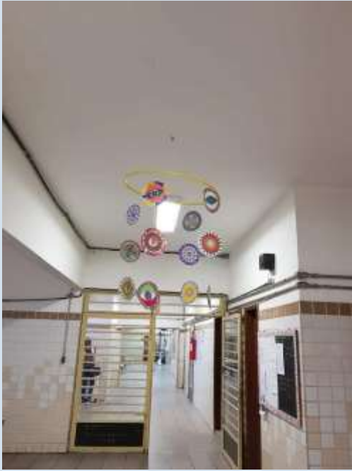
Pátio interno da escola