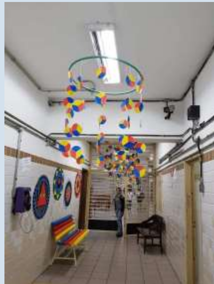
entrada da secretaria