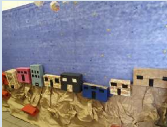
Montagem da instalação com as casas feitas de material reciclado

-7ºB – após estudo das histórias da região, os alunos fizeram xilogravuras feitas em isopor reciclado, desenhando imagens retiradas das fotos;