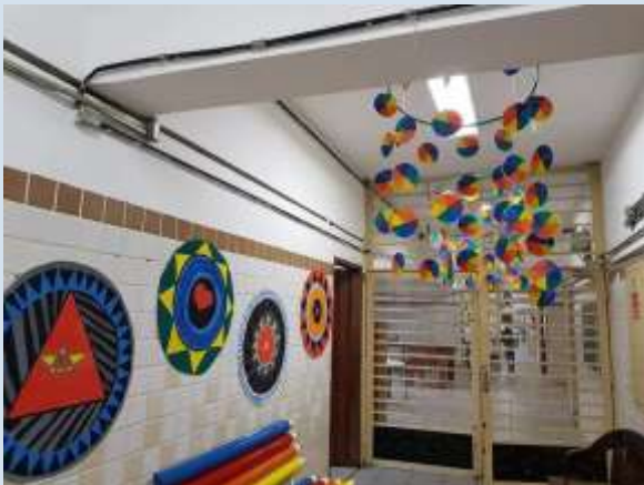
Entrada da secretaria

Primeiro trabalhamos o conceito, com a construção do círculo cromático e transformamos estes círculos em móveis para decoração do espaço da entrada da secretaria da escola.