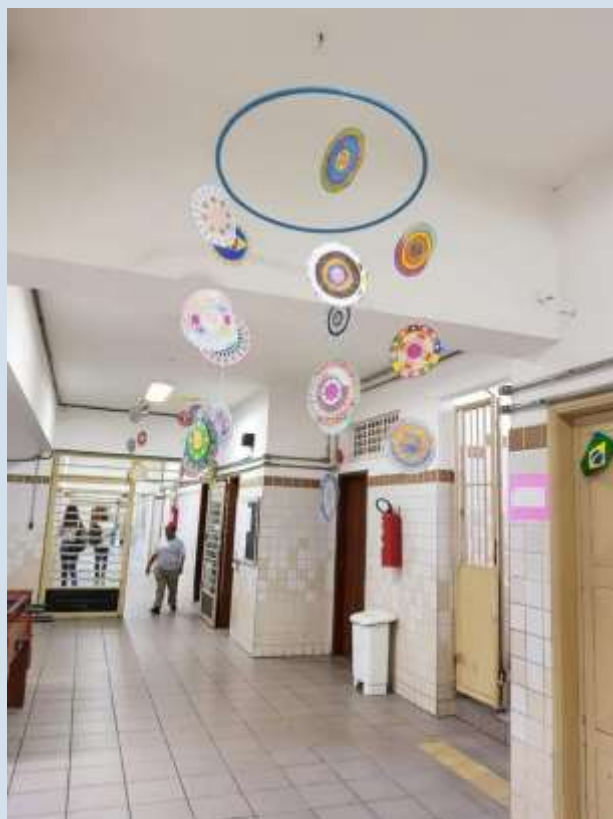
Pátio interno da escola