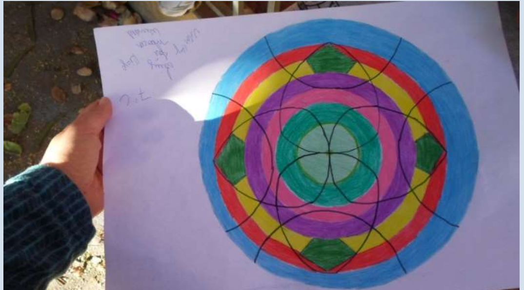
Mandala desenhada por aluno do 7º ano