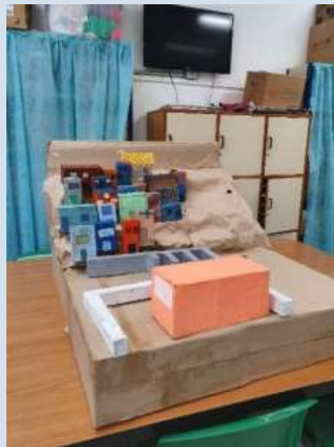
Início da confecção da maquete com materiais reciclados