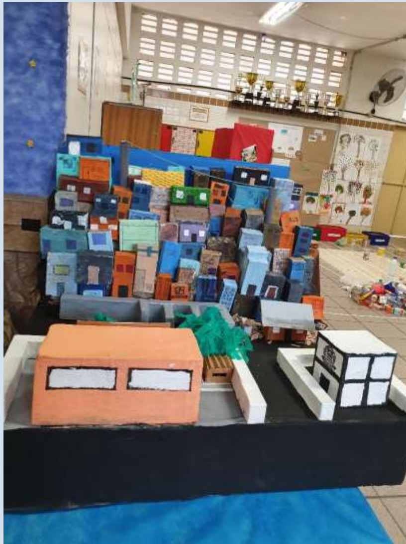
Maquete exposta na Feira Cultural

- 7º D – após estudo da geometria das construções, os alunos confeccionaram sólidos geométricos, decoraram com estampas e montaram móveis. Além dos sólidos, os alunos escolheram casas das fotos e pintaram os espaços geométricos: