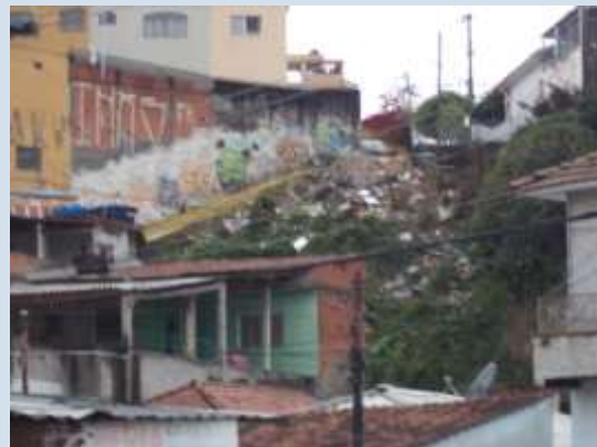
CASARIO DO MORRO EM FRENTE A ESCOLA