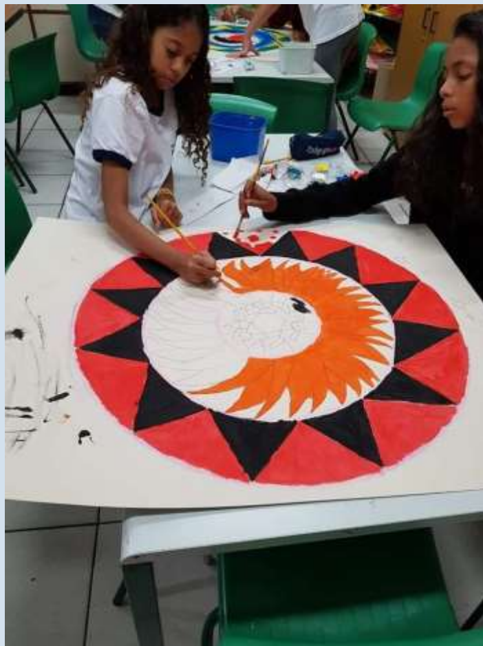
Mandalas confeccionadas em grupo