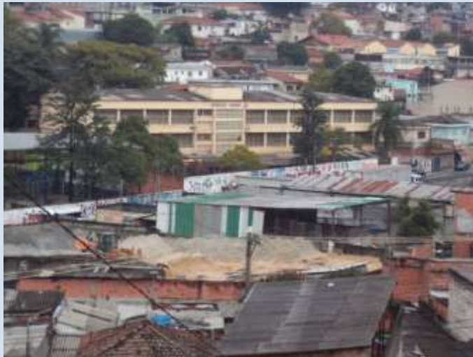
E.M.E.F.GERALDO SESSO JR

A E.M.E.F. Geraldo Sesso Jr., localiza-se na periferia de São Paulo no bairro da Brasilândia. Está inserida dentro de uma comunidade com inúmeras carências. O que separa a escola do morro é apenas uma “rua”, que não é asfaltada e usada por muitos caminhões. A escola se confunde com as casas em alvenaria; é uma construção antiga, com muros altos e grades. Seu pátio era pintado em tom terracota; o que os alunos achavam bem feio.