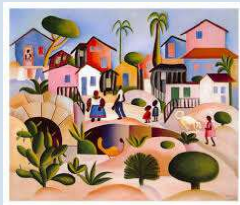
Morro da Favela – Tarsila do Amaral