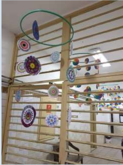
pátio interno da escola