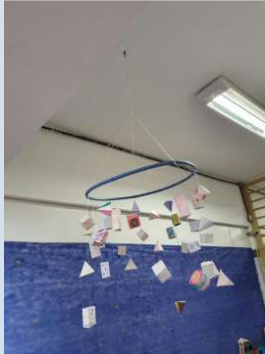
Móbile dos poliedros decorados