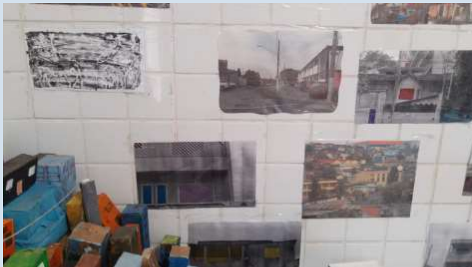
Fotos com espaços geométricos em destaque