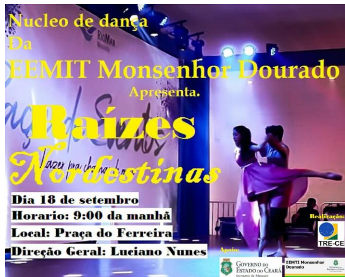
Semana da justiça eleitoral