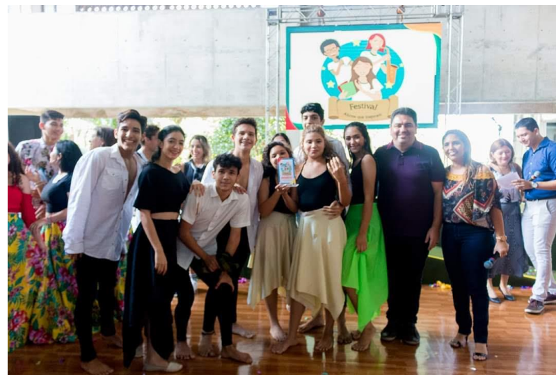
festival alunos que ispiram