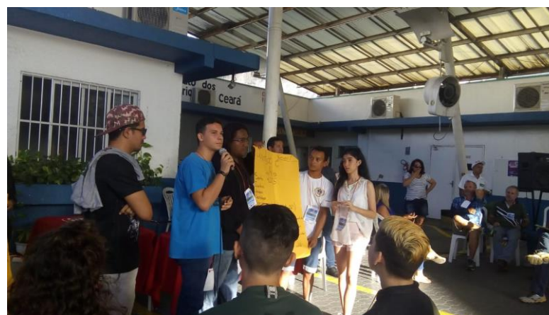
encontro de juventude