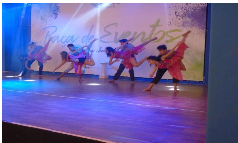
Festival da juventude