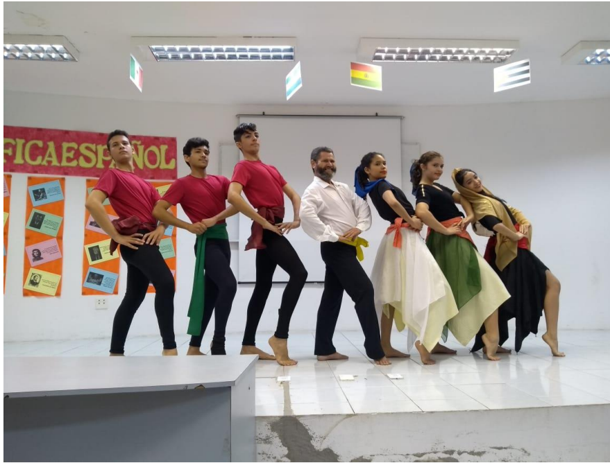
| semana espanica da UESE