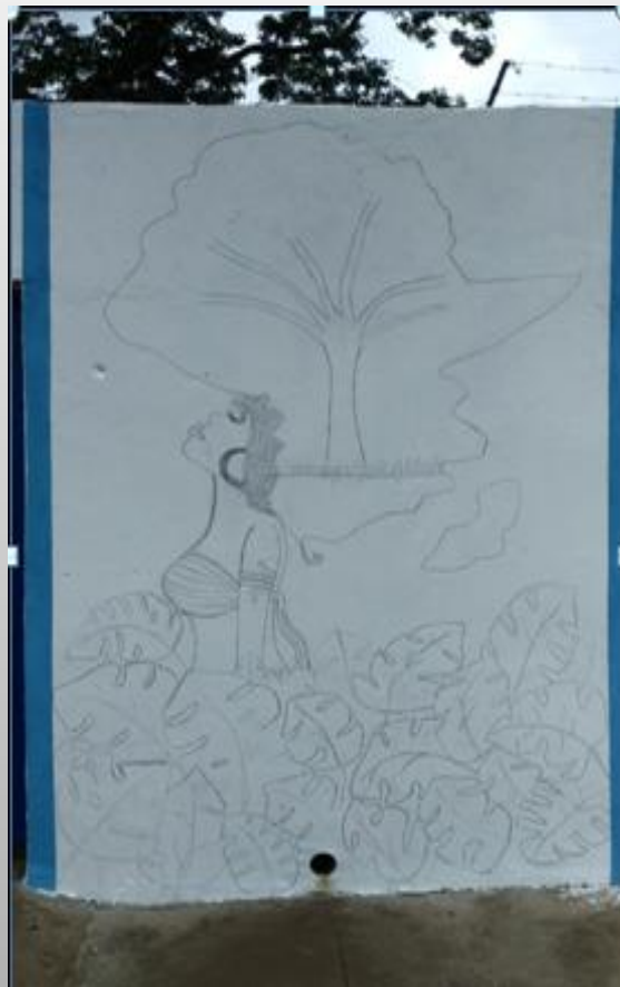
Esboço pronto da composição de pintura africana