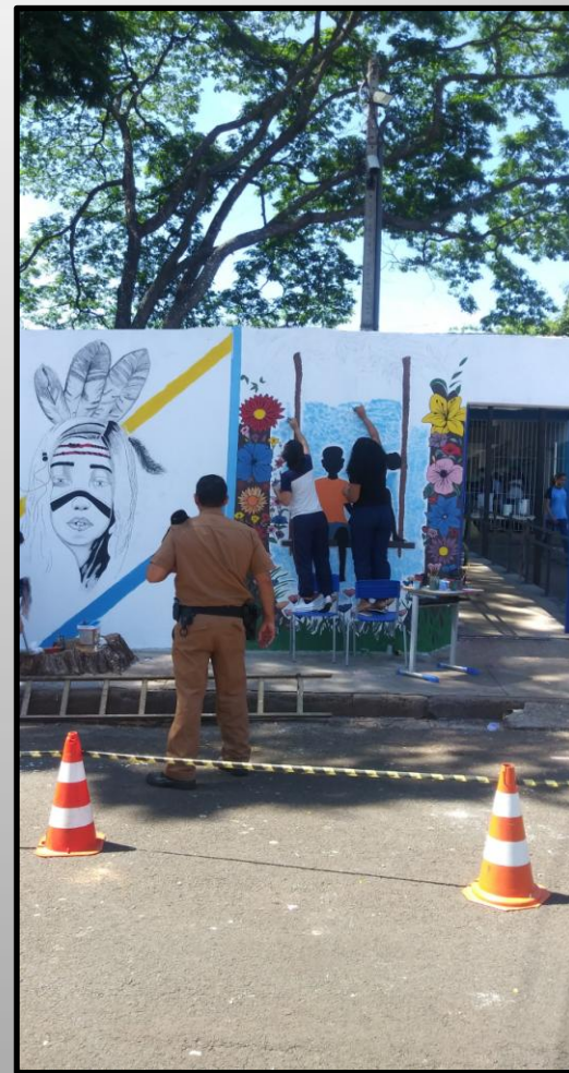
Alunas fotografadas pelo Policial Militar da Escola