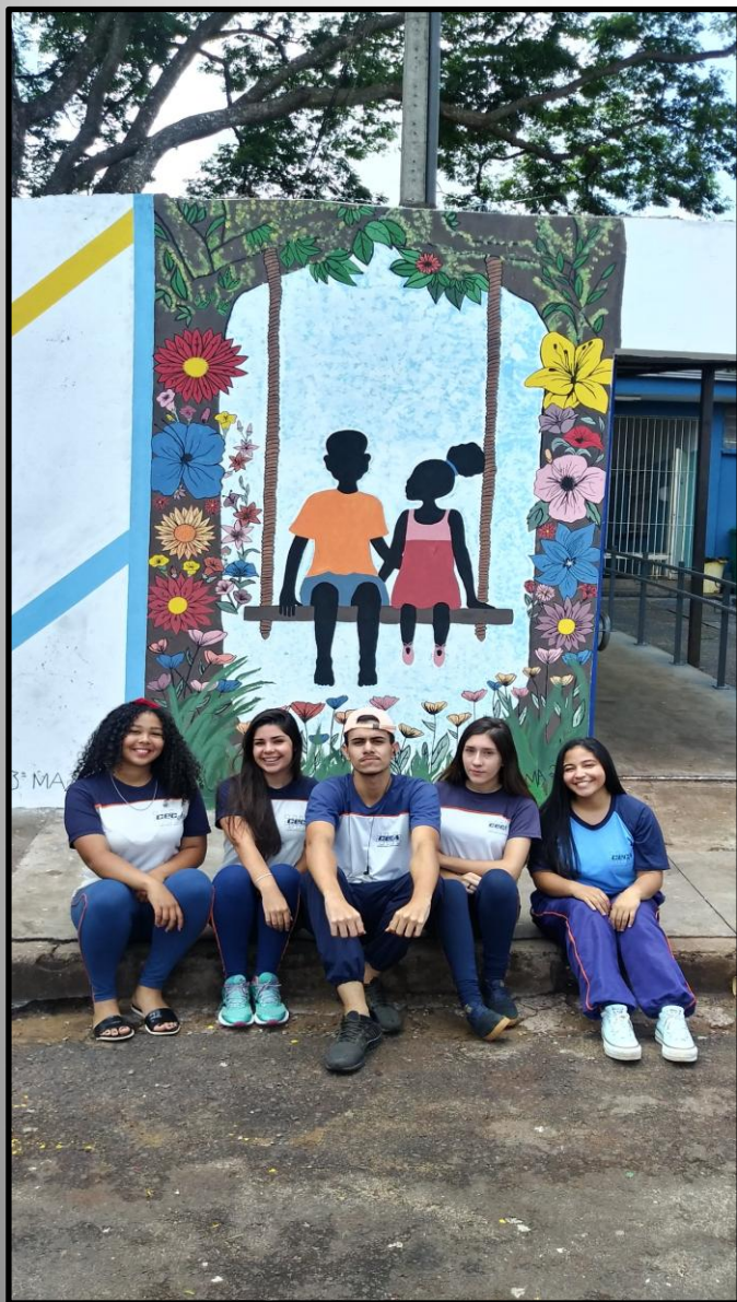
Alunos com o Trabalho concluído