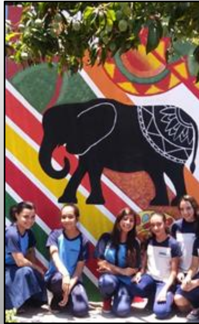
Alunas com o trabalho concluído da composição africana