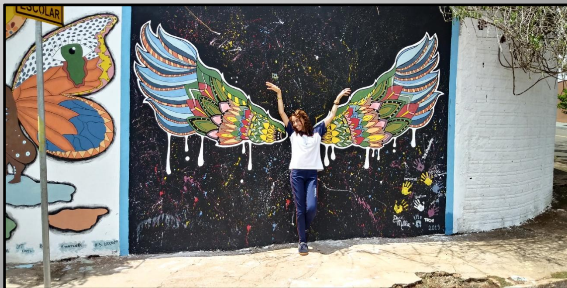
Aluna no trabalho concluído