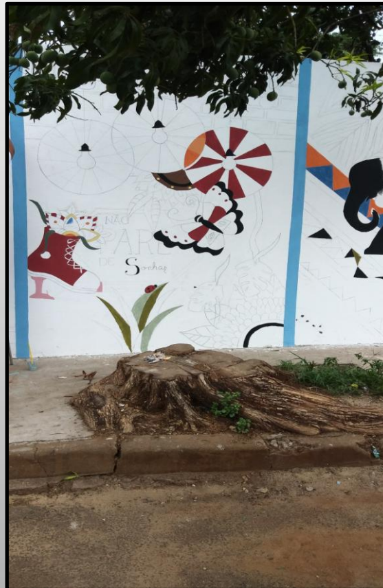
Parcial da composição