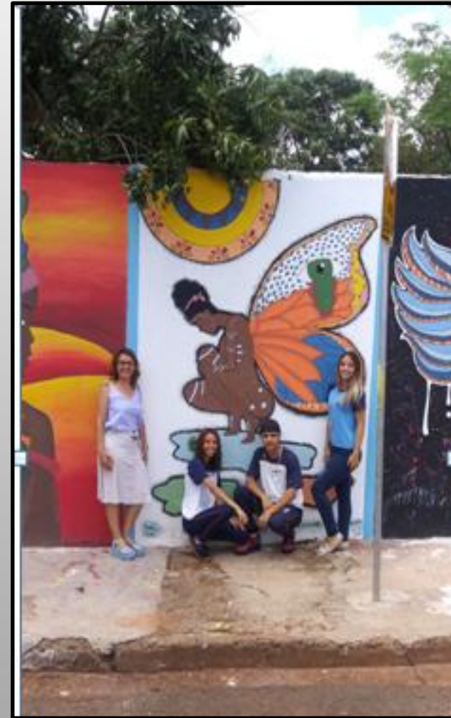
Esboço da composição surrealista africana