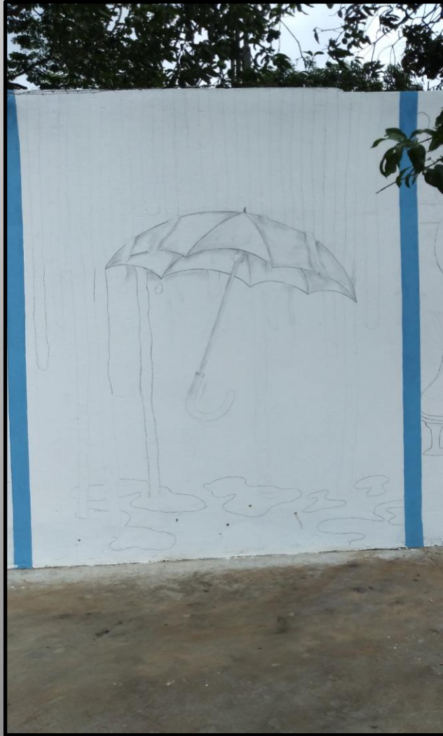
Esboço da composição