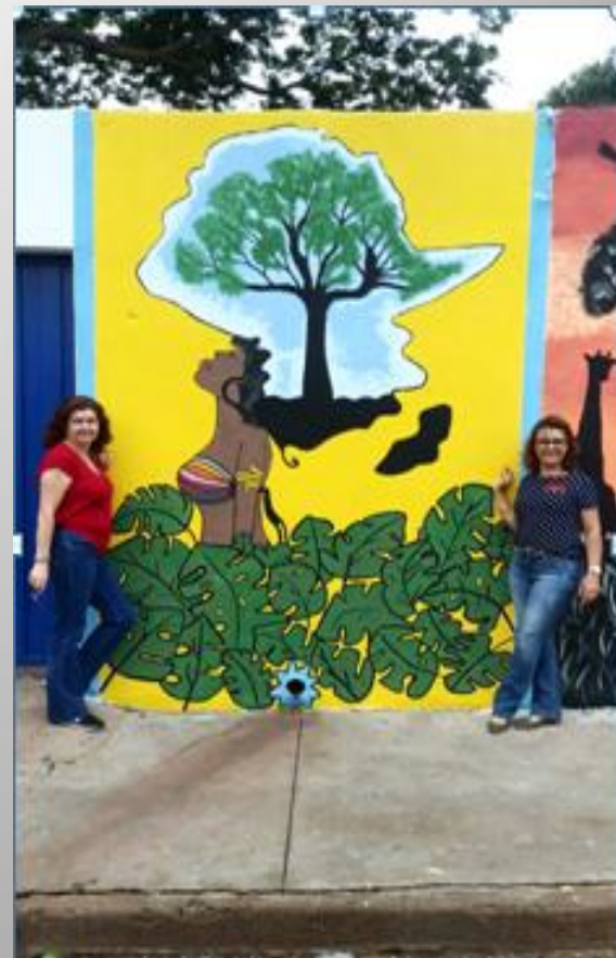
Trabalho da pintura africana concluído