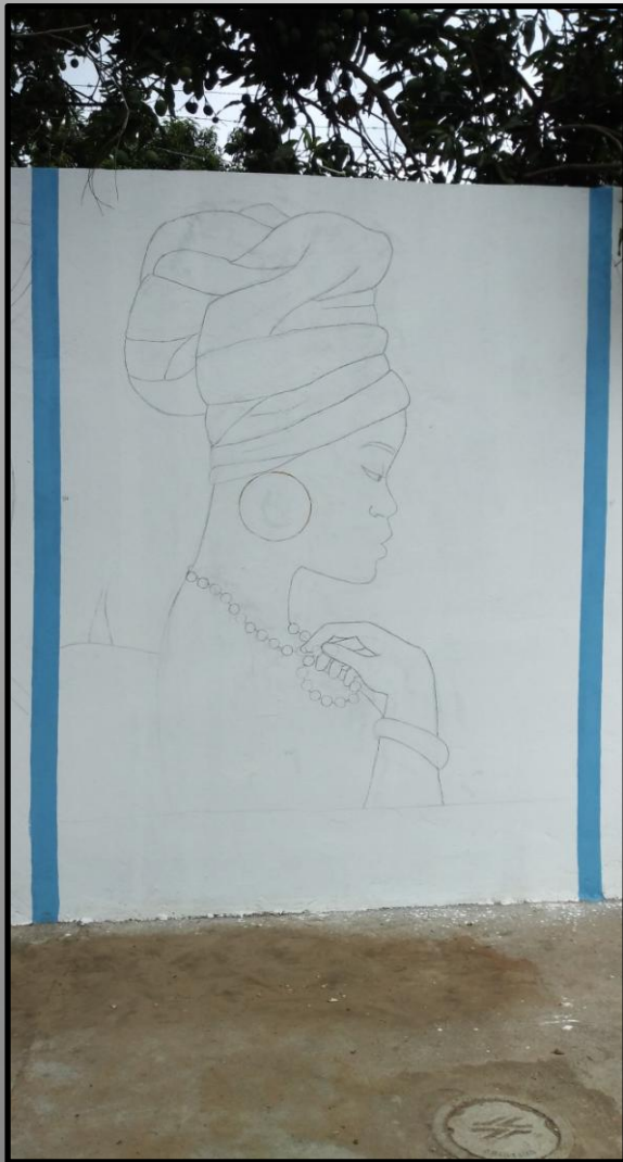
Esboço da personagem da cultura africana