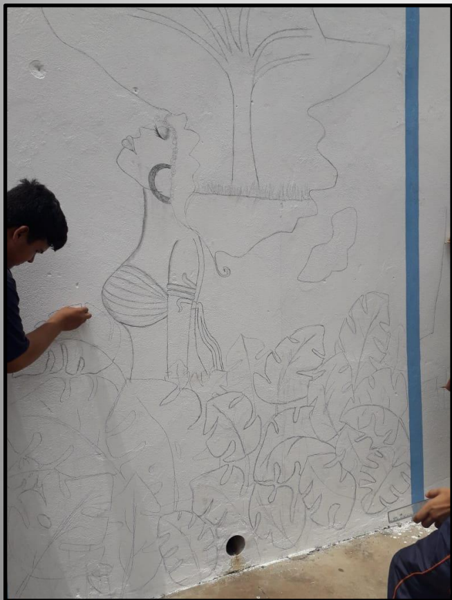
Esboço da composição de pintura africana sendo executado pelo aluno