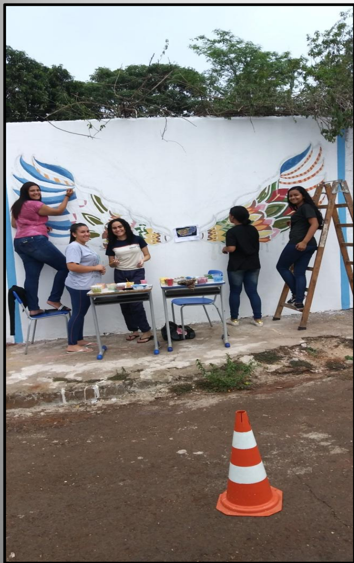
Parcial da composição com alunas