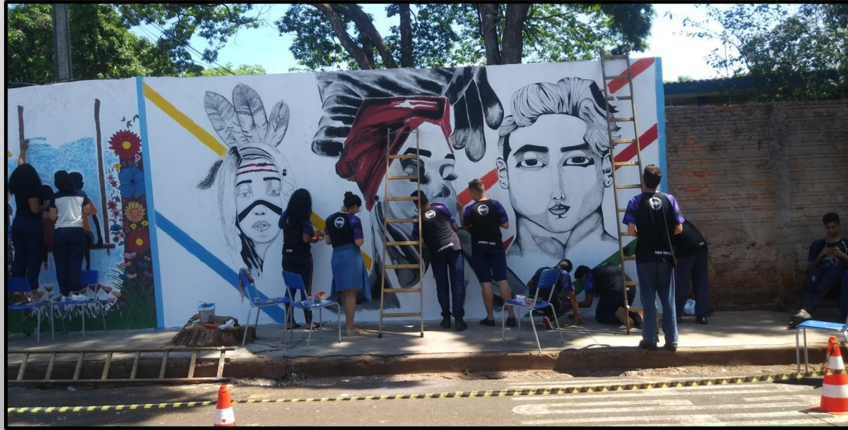
Alunos do 3º ano executando a Pintura Étnica.