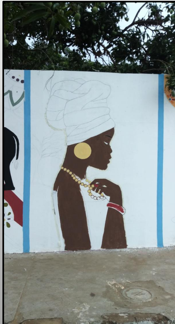
Parcial do trabalho da cultura africana