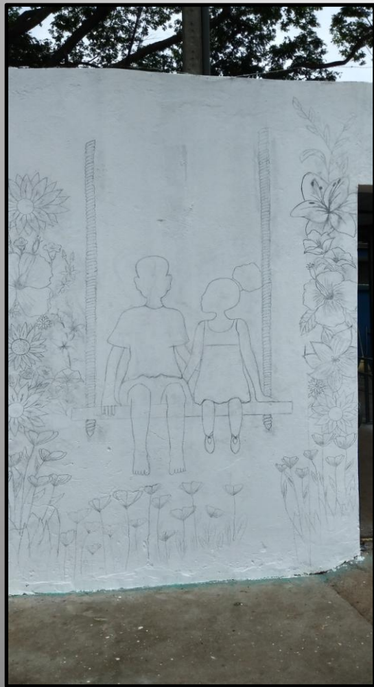
Esboço do desenho de crianças africanas no balanço