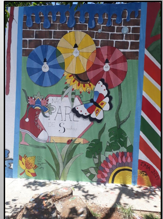
Trabalho concluído da composição