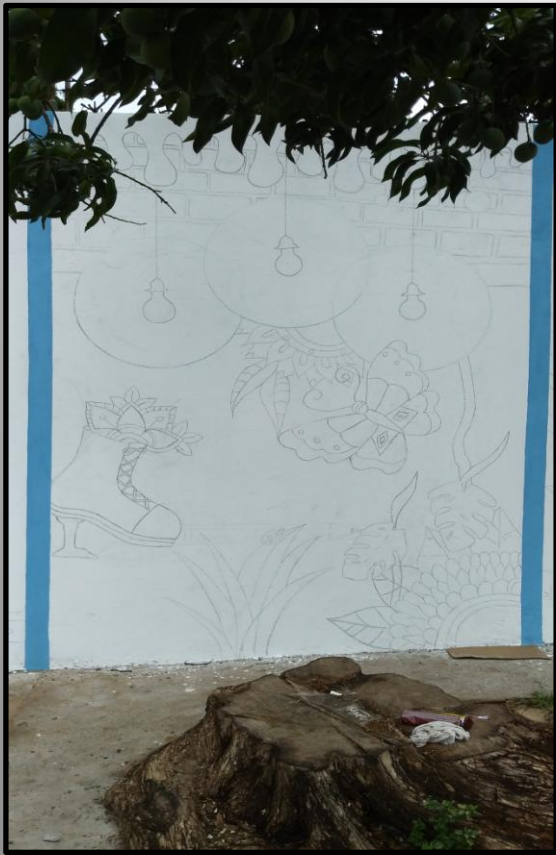
Esboço da composição