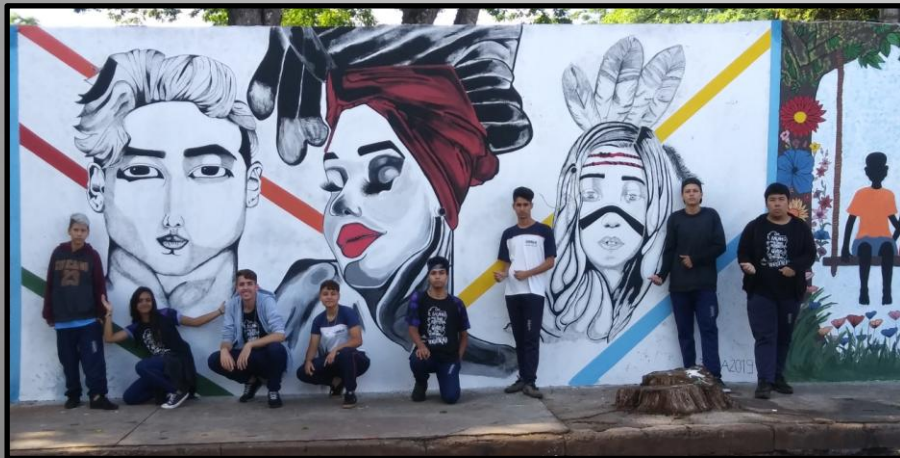
Alunos do 3º ano – Foto com Trabalho Pronto