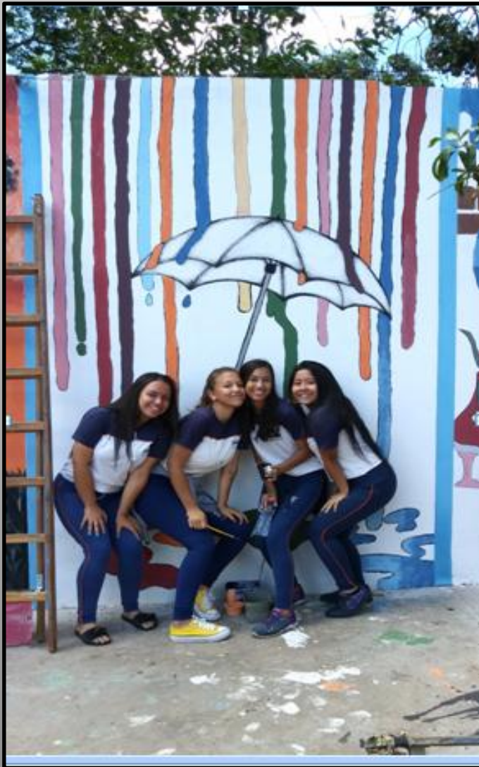
Alunas com o trabalho concluído