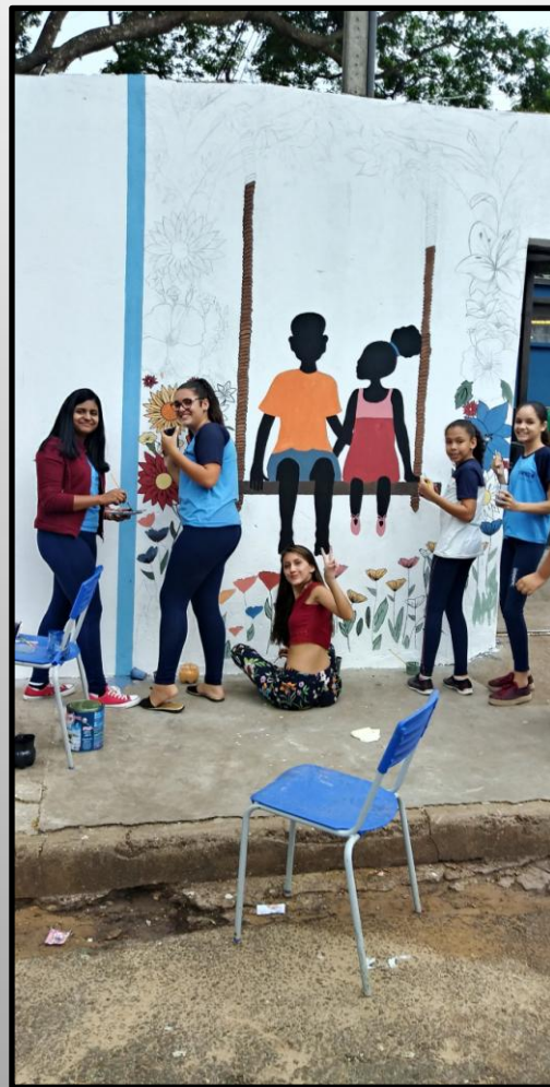
Alunas pintando o desenho