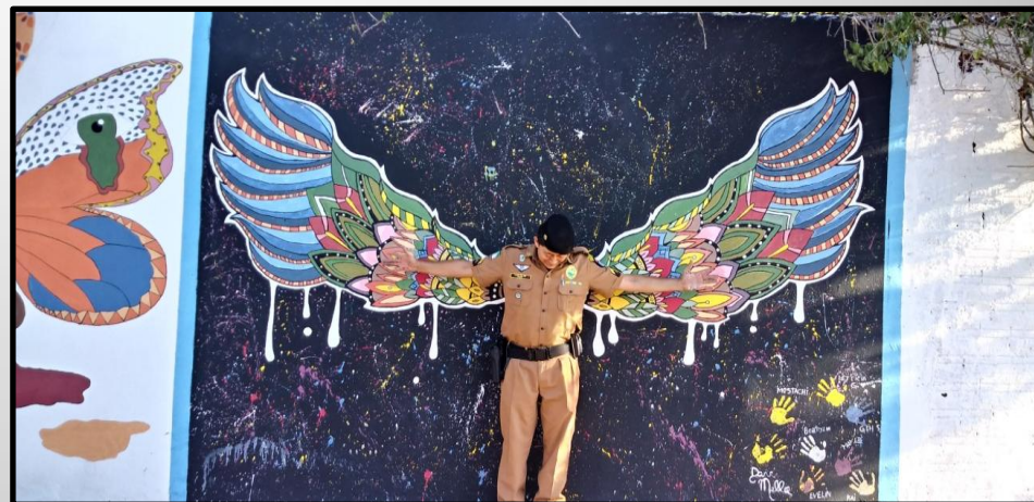
Policia no trabalho concluído