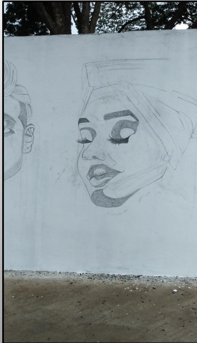
Negra - Afro