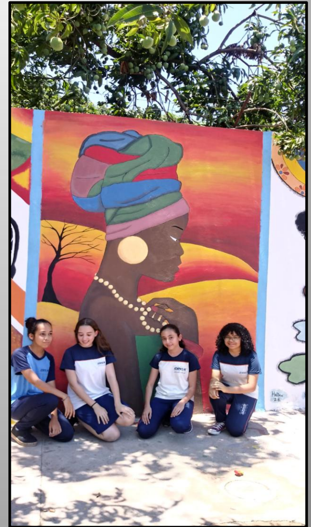
Alunas com pintura africana concluída