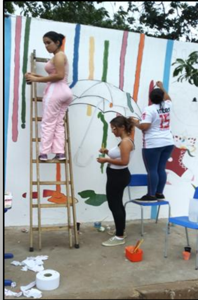
Alunas pintando a composição