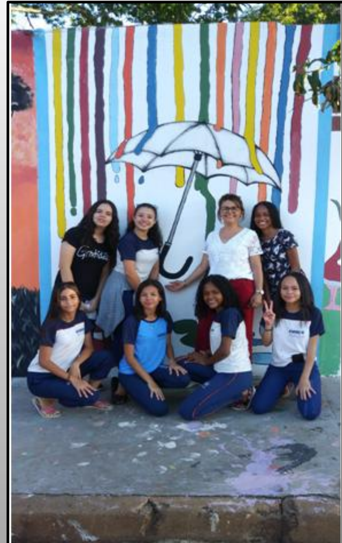
Alunas e Professoras com o trabalho concluído