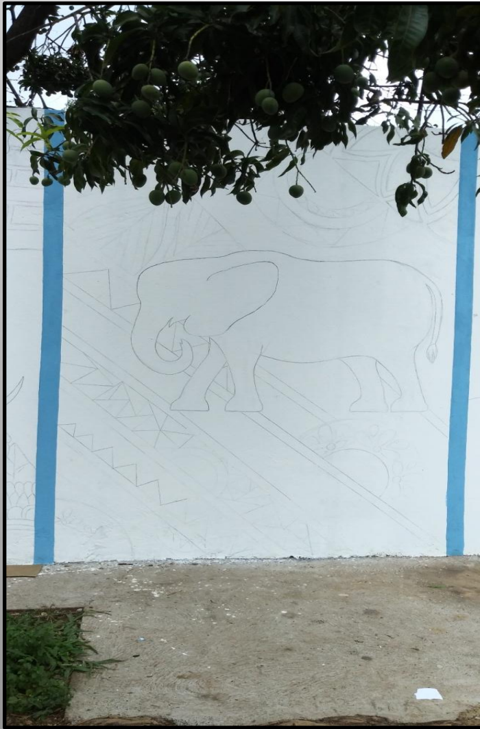
Esboço da composição africana