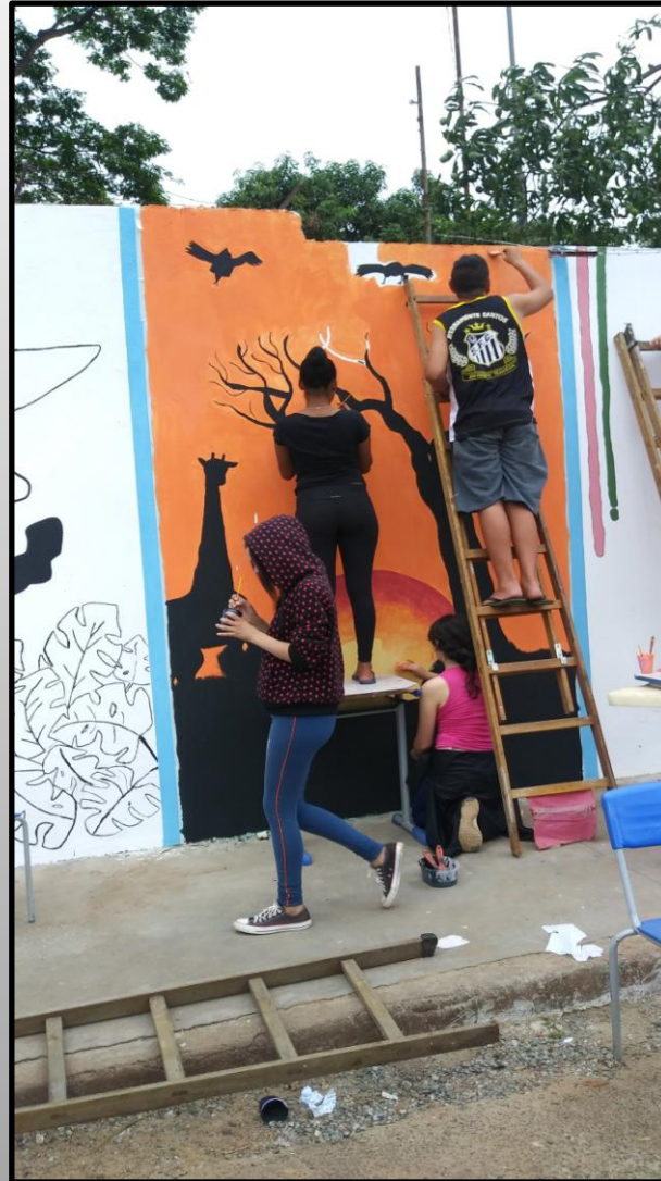
Parcial do trabalho da savana africana