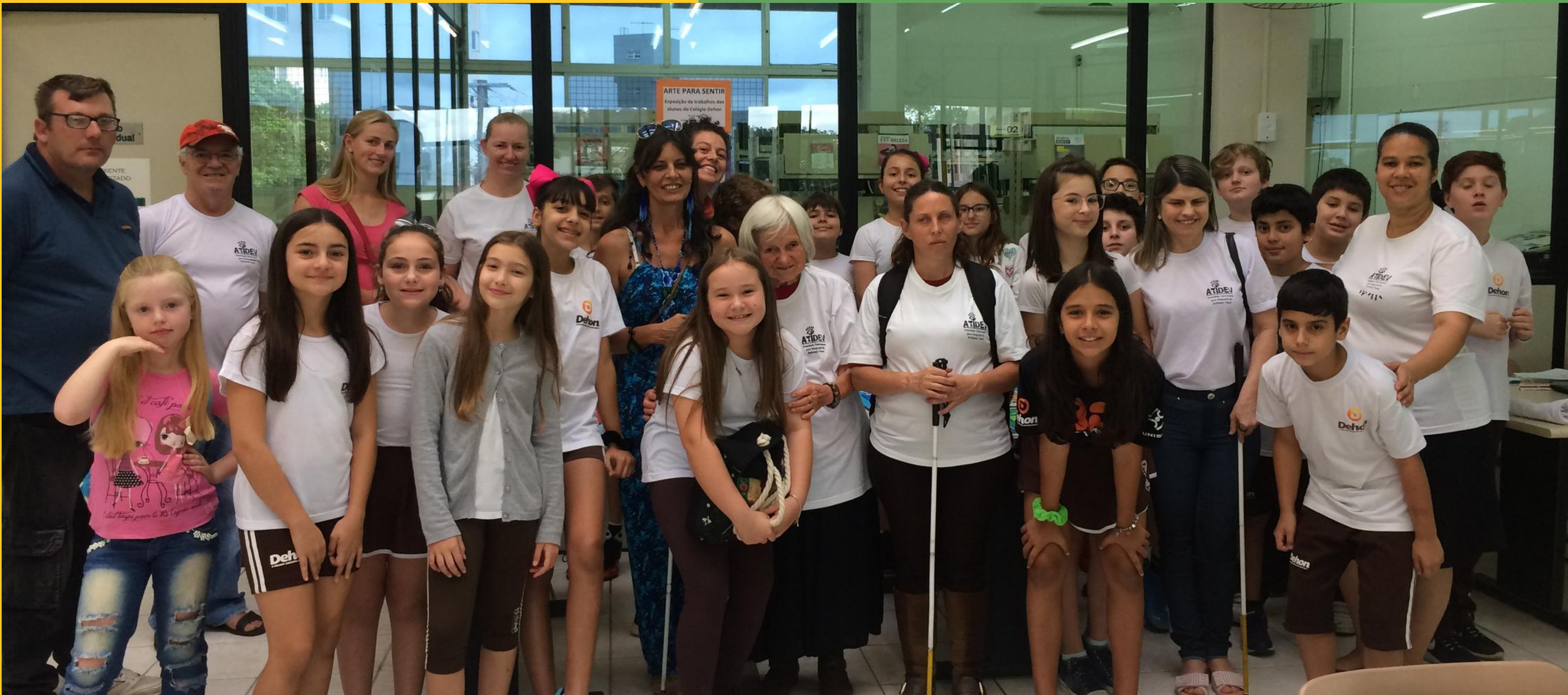
VISITANTES DA EXPOSIÇÃO E OS ESTUDANTES.