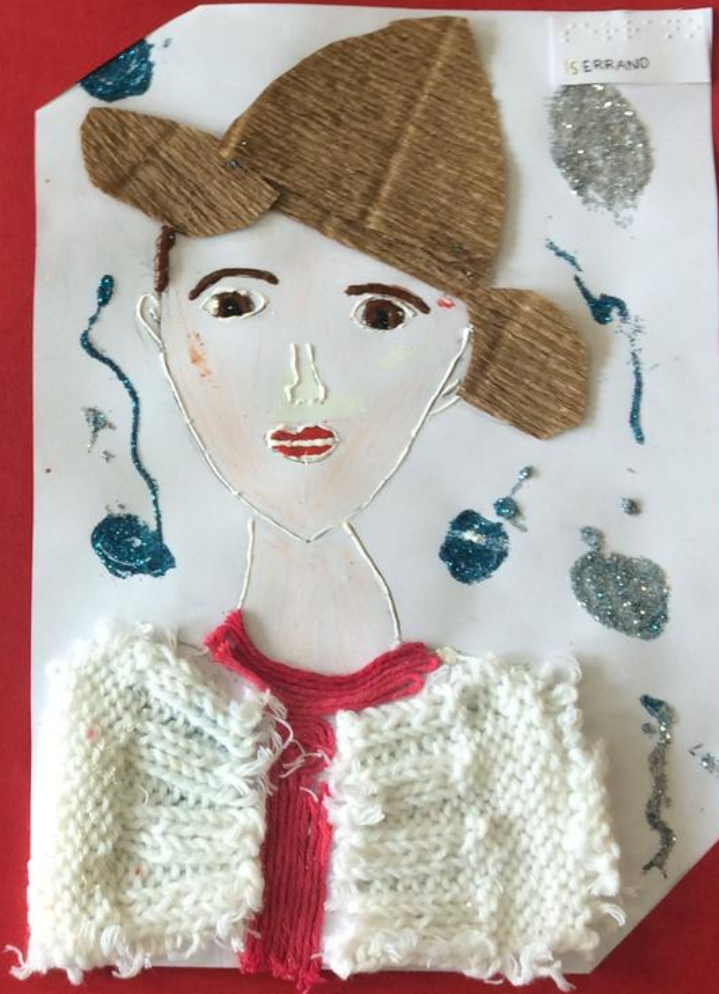
atorretrato - Serrano improvisado (1997)