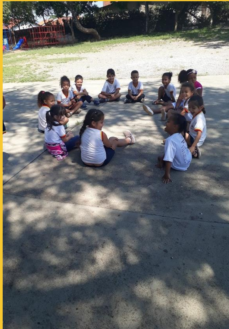
RODA DE CONVERSA COM ALUNOS

Inicialmente, houve diálogo durante os momentos de roda de conversa com questões sobre o entendimento dos alunos a cerca do que consideram Música, suas preferências e de seus familiares.