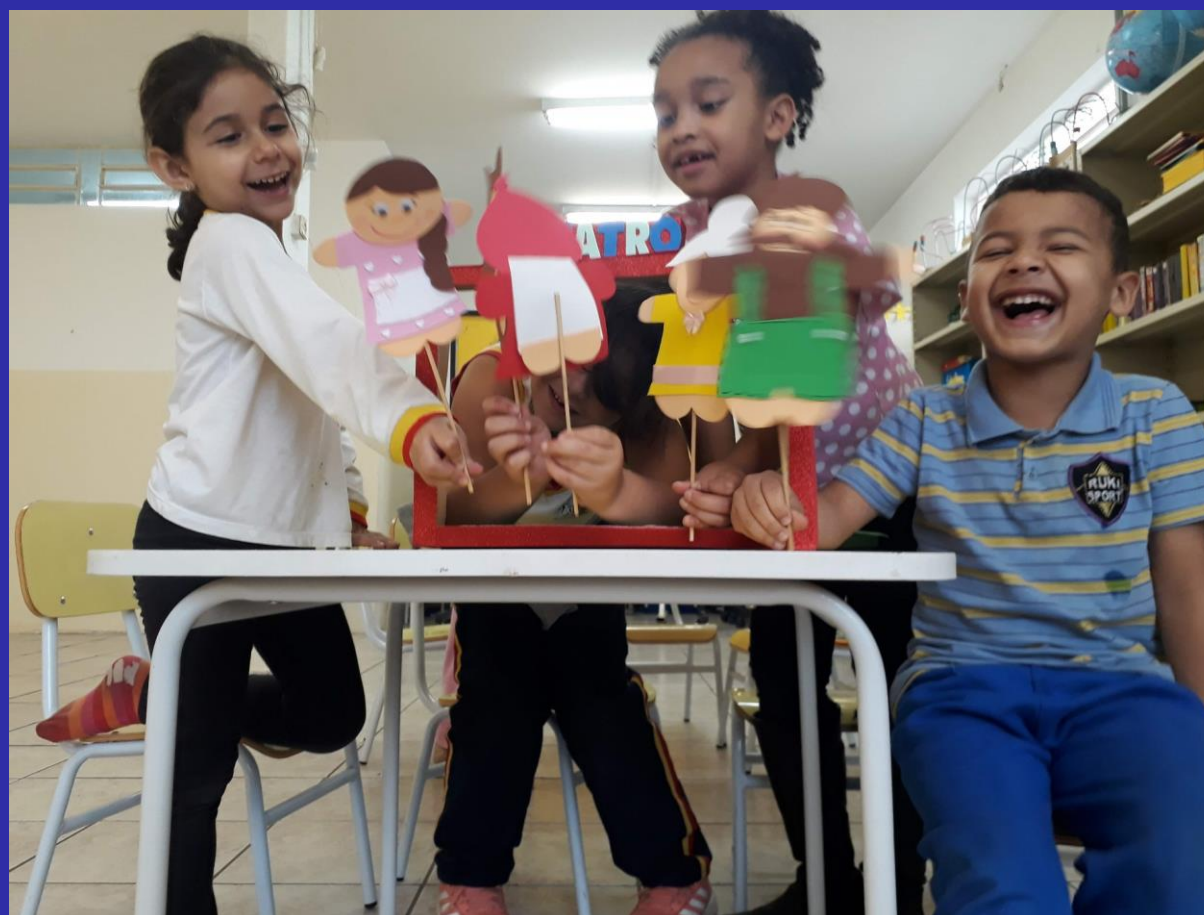
CRIANÇAS EXPLORANDO PALITOCHEs DE PERSONAGENS E PERCEPÇÃO MUSICAL PRESENTE NA HISTÓRIA – CONTO “CHAPEUZINHO VERMELHO”

Aulas práticas e expositivas com literatura— histórias e contos com teor musical.