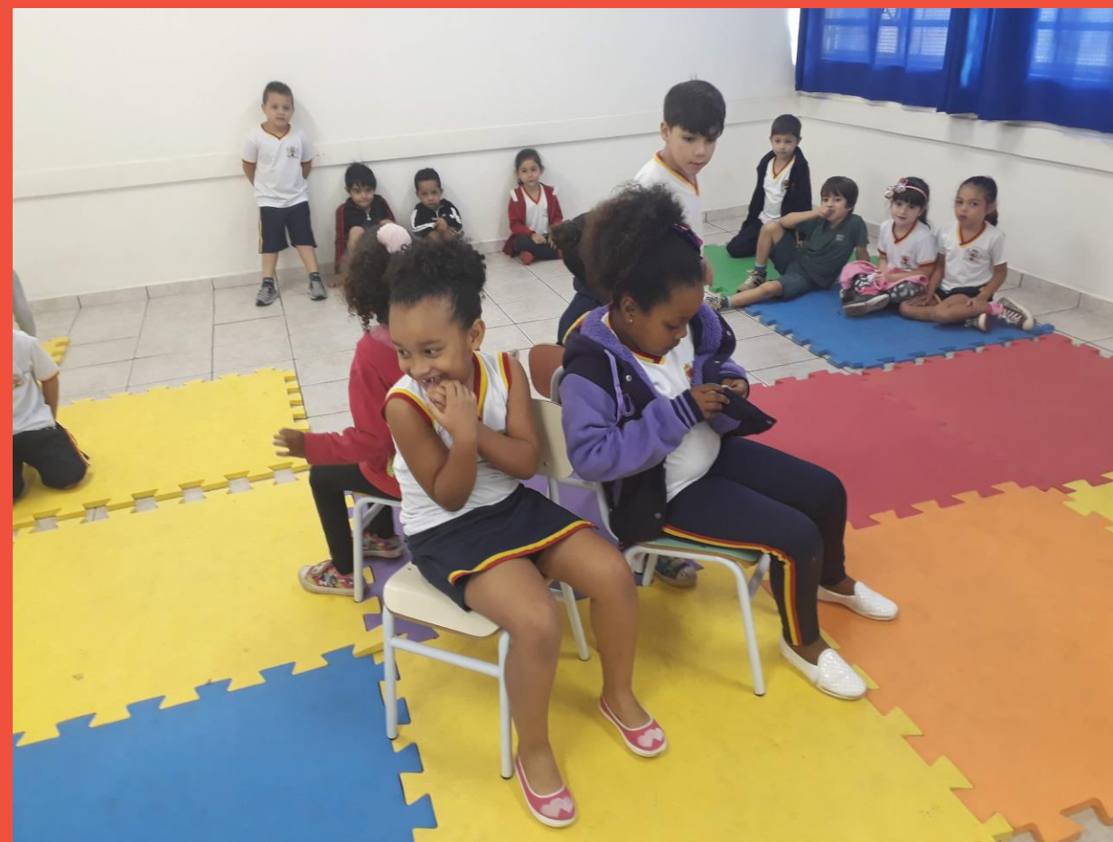
DANÇA DAS CADEIRAS – ATIVIDADE COM USO DE MÚSICAS DE DIFERENTES REPERTÓRIOS E ESTILOS

Apreciação – através de atividades com experiência de escuta de obras estéticas variadas, sons e músicas do cotidiano.