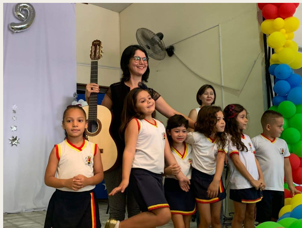
AO LONGO DAS AULAS UTILIZAVA O INSTRUMENTO VIOLÃO COMO APOIO E BASE

Parâmetros sonoros – altura, intensidade, timbre, duração: experimento de atividades ao longo das aulas que contemplassem as propriedades do som, tendo como recurso áudios selecionados e o violão como instrumento de base