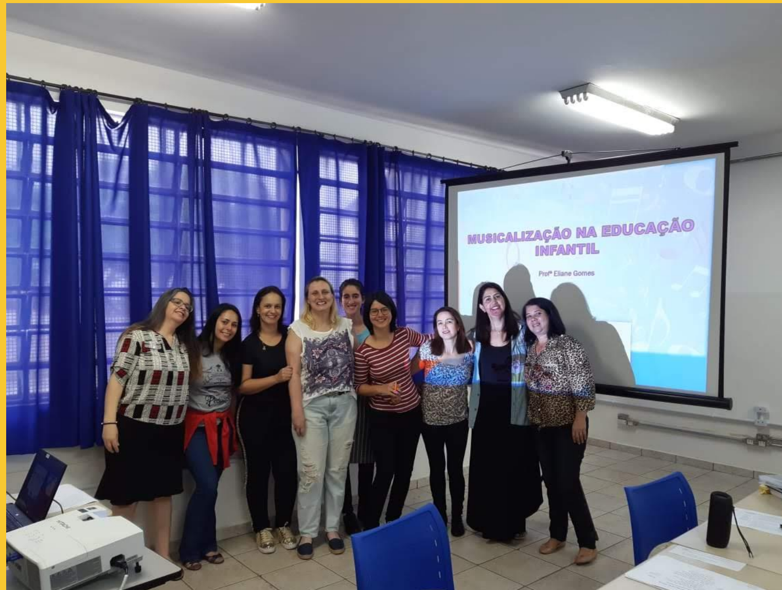
FORMAÇÃO COM PROFESSORAS, ESTAGIÁRIAS E GESTORA DA UNIDADE ESCOLAR SOBRE MUSICALIZAÇÃO

Formação com os professores e gestão da unidade escolar onde, além de experimentarem vivências realizadas com os alunos, toda a equipe se prontificou a estimular a coleta de materiais recicláveis e de sucata, para a realização da oficina “Orquestra de sucata”