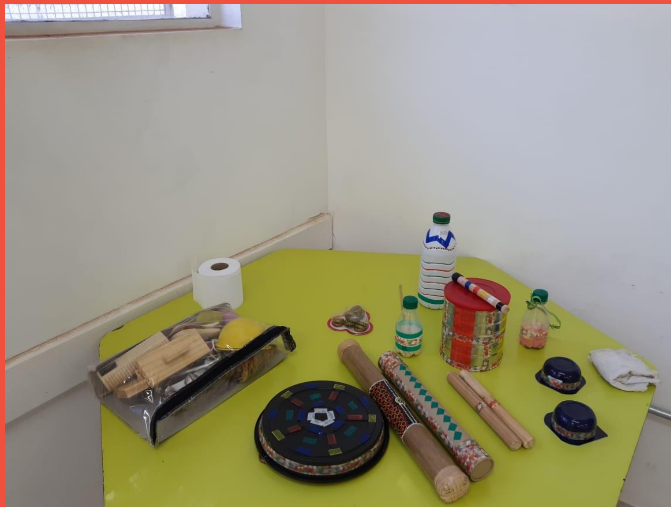
INSTRUMENTOS DE MUSICALIZAÇÃO FORMAIS E CONFECCIONADOS COM MATERIAIS DIVERSOS

Exploração instrumental – execução através de instrumentos musicais de sucata, confeccionados pelos alunos e também com os instrumentos acessíveis – especialmente os de percussão – clavas, chocalhos, caxixis, tambores