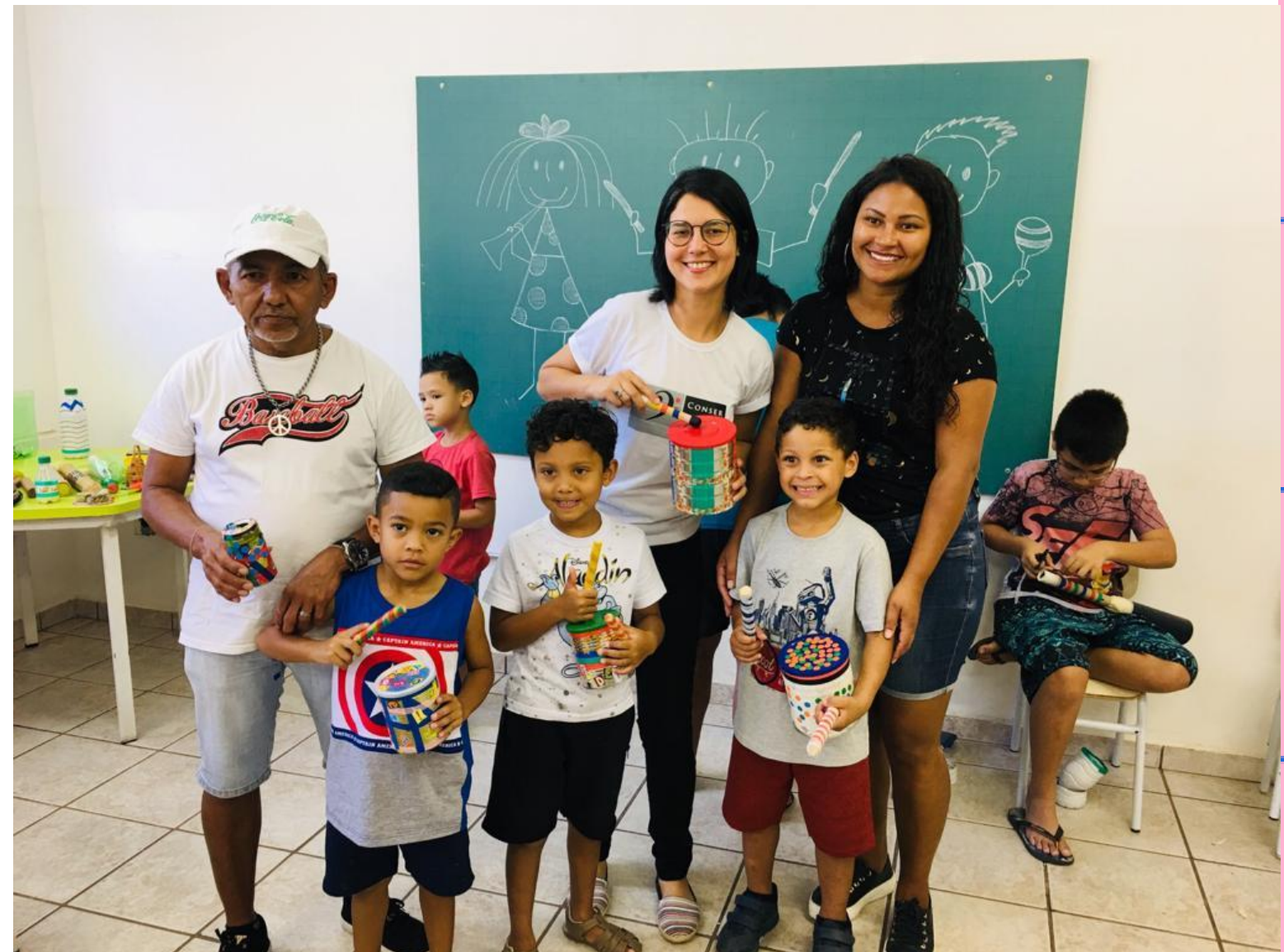
OFICINA "ORQUESTRA DE SUCATA" – INSTRUMENTOS CONFECCIONADOS PELOS ALUNOS E SUAS FAMÍLIAS