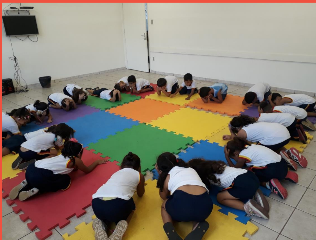
ATIVIDADE MUSICAL “SETE SALTOS” – BASEADA NO EDUCADOR CARL ORFF

Motricidade – através de atividades musicais que oportunizaram a relação com o corpo, movimentos rítmicos expressivos, coordenação do corpo como um todo, com uso de cantigas de roda.