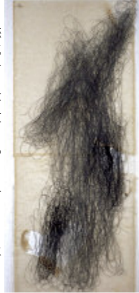
Edith Derdyk, desenho linha preta de algodão e papel japonês 14x05x0, 1997