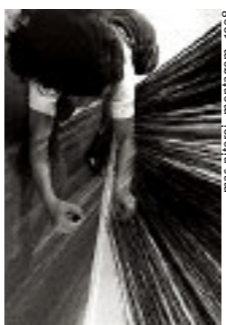
mae-niteroi, montagem, 1998